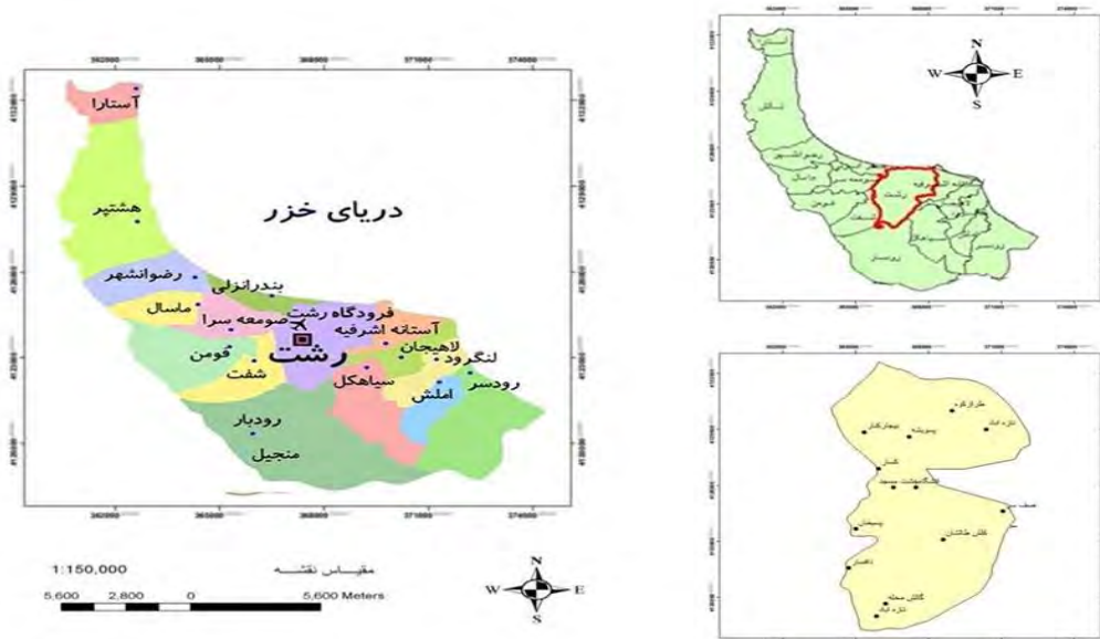
شکل (۱): موقعیت جغرافیایی محدوده مورد مطالعه (استانداری گیلان، تقسیمات سیاسی استان، ۱۳۹۵)