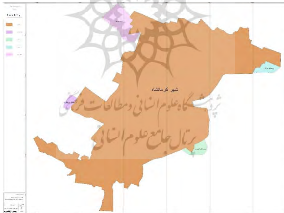
شکل (۲): توزیع جغرافیایی روستاهای مورد مطالعه