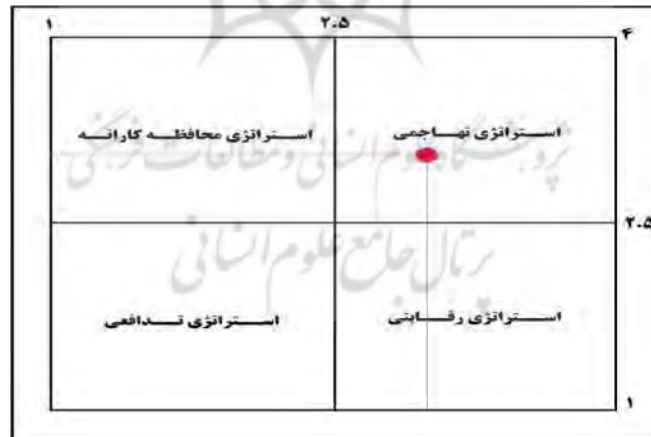
شکل (۲): نمودار تعیین استراتژی سوات