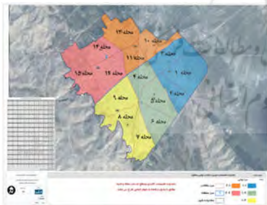
شکل (۲): محلات ۱۵ گانه شهر ایذه