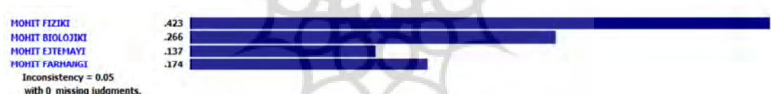
شکل (۳): وزن نهایی عامل‌ها

همانطور که در دو شکل (۱ و ۲)، ملاحظه می‌شود، در بین شاخص‌های زیست محیطی، به ترتیب شاخص محیط فیزیکی با وزن به دست آمده ۰/۴۲۳، شاخص محیط بیولوژیکی با وزن به دست آمده ۰/۲۶۶، شاخص محیط فرهنگی با وزن ۰/۱۷۴، شاخص محیط اجتماعی با وزن ۰/۱۳۷، بالاترین و پایین‌ترین وزن‌ها را به خود اختصاص داده‌اند. بررسی و سنجش تاثیر پروژه احداث ورزشگاه ۳۰ هزار نفری امام رضا بر شاخص‌های زیست محیطی جهت سنجش تاثیر پروژه احداث ورزشگاه ۳۰ هزار نفری امام رضا در شاخص‌های زیست محیطی با استفاده از نرم افزار SPSS و آزمون همبستگی اسپیرمن پرداخته شده است. در جدول ذیل به طور کامل توضیح داده شده است همانطور که در جدول (۶) ملاحظه می‌شود، در تمامی شاخص‌های مطرح شده به ترتیب شاخص محیط بیولوژیکی با سطح معناداری ۰/۰۸۹ و correlation به دست آمده ۰/۲۳۴، شاخص محیط فرهنگی با سطح معناداری ۰/۱۰۲ و correlation ۰/۳۴۵، شاخص محیط فیزیکی با سطح معناداری ۰/۰۹۹ و correlation با ۰/۲۴۵، محیط اجتماعی-اقتصادی با سطح معناداری ۰/۱۱۳ و correlation ۰/۴۳۲، سطح معناداری به دست آمده بیشتر از ۰/۰۵، می‌باشد که نشان‌دهنده عدم رابطه