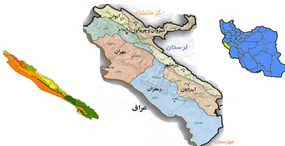
شکل (۱): موقعیت جغرافیایی شهرستان دره شهر در کشور و استان