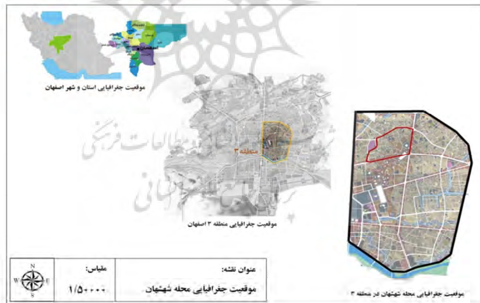
محله شهشهان شکل (۱): موقعیت جغرافیایی محلات مورد مطالعه بازترسیم: نویسندگان ۱۳۹۵