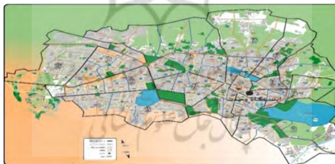
شکل (۱): موقعیت ایستگاه‌های سنجش آلودگی هوا در سطح شهر مشهد

جهت انجام این پژوهش، از داده‌های آلودگی هوا که از اداره کل حفاظت محیط زیست خراسان رضوی تهیه شده استفاده گردید. داده‌های آلودگی هوا مربوط به ایستگاه وحدت واقع در مرکز شهر مشهد بوده است. آلاینده‌ها شامل منوکسید کربن، دی اکسید نیتروژن، دی اکسید گوگرد، ازن و ذرات معلق ( PM_{10} )