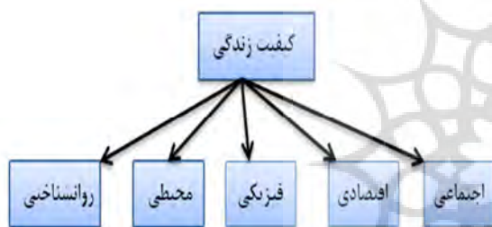
شکل (۲): ساختار کلی کیفیت زندگی

سنجش آن تدوین نمود. بنابراین اولین گام در راستای سنجش کیفیت زندگی انتخاب ابعاد آن و سپس انتخاب شاخص‌هایی است که با استفاده از آن بتوان ابعاد مختلف کیفیت زندگی شهری را مورد سنجش قرار داد (لطفی، ۱۳۸۸: ۷۱). طبق نظر شالوک ۱ ، ابعاد کیفیت زندگی به مجموعه‌ای از عوامل ارجاع دارد که احساس بهزیستی شخصی را به وجود می‌آورند (Schalock, 2004: 205). و شاخص‌های کیفیت زندگی نیز به مجموعه فاکتورهایی، که به منظور ارزیابی فرآیندها و پدیده‌ها در طول زمان به کار می‌روند، گفته می‌شود. به طور کلی مطالعات صورت گرفته شده در ارتباط با مفهوم کیفیت زندگی شهری در کشورهای مختلف نشان می‌دهد که مفهوم کیفیت زندگی دارای ابعادی به شرح شکل (۲) می‌باشد.