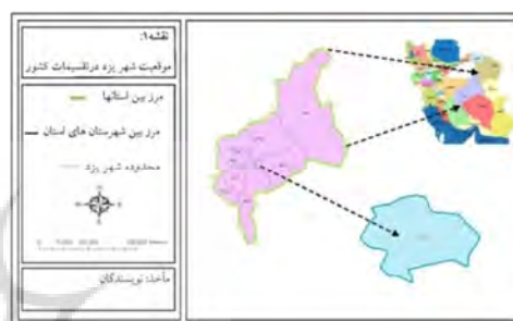
شکل (۱): موقعیت شهر یزد در تقسیمات کشوری

کویر واقع شده است. این استان از شمال به استان اصفهان، از جنوب به استان کرمان، از شرق به استان خراسان و از غرب به استان‌های اصفهان و فارس محدود می‌باشد. شهر یزد، مرکز شهرستان یزد، با ارتفاع ۱۲۳ متر از سطح دریا و وسعت ۹۹/۵ کیلومتر مربع در مرکز استان یزد در طول ۵۴ درجه و ۲۲ دقیقه و ۳ ثانیه شرقی و ۳۱ درجه و ۵۳ دقیقه و ۴۹ ثانیه شمال جغرافیایی قرار دارد. جمعیت شهرستان یزد بر اساس آخرین سرشماری ۵۲۶۲۷۶ نفر می‌باشد که ۴۳۳۱۹۴ نفر آن در شهر یزد سکونت دارند (مرکز آمار ایران، ۱۳۹۱).