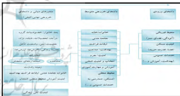
شکل (۳): چهارچوب مفهومی کیفیت زندگی

عبارتند از: ۱- احساس بهزیستی هیجانی (ارضا، عزت نفس و فقدان استرس) ۲- روابط بین شخصی (کنش‌های متقابل، ارتباطات و حمایت) ۳- احساس بهزیستی مادی (پایگاه ملی، وضعیت اشتغال و مسکن) ۴- رشد فردی (آموزش، شایستگی فردی و عملکرد) ۵- احساس بهزیستی فیزیکی (سلامت، فعالیت جسمی زندگی روزمره، فراغت) ۶- حق تعیین سرنوشت (استقلال شخصی، اهداف، ارزش‌ها و انتخاب‌ها) ۷- پذیرش و ادخال اجتماعی (مشارکت، نقش‌های اجتماعی و حمایت‌های اجتماعی) ۸- حقوق (حقوق بشر و حقوق قانونی مثل شهروندی) (Schalock,2004:206). همچنین شاخص‌های سازمان بهداشت جهانی مفاهیمی همچون سلامت جسمی، وضعیت روان‌شناسی، سطوح عدم وابستگی، روابط اجتماعی، عقاید فردی و ارتباط این مسائل با خصوصیات محیط اطراف را در برمی‌گیرد (WHO,1999:3). شکل زیر چهارچوب سیستماتیک و مفهومی کیفیت زندگی را نشان می‌دهد. در این تحقیق شاخص‌های مورد مطالعه بر اساس ابعاد مطرح شده در شکل (۲) و چهارچوب مفهومی کیفیت زندگی در شکل (۳) انتخاب شده‌اند.