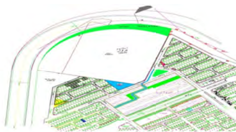
نقشه (۳): موقعیت مجتمع‌های مسکن مهر کارکنان دولت شهر ایلام

مجموع کل پاسخگویان این پژوهش ۱۹۶ نفر معادل ۶۵/۱ درصد مرد و ۱۰۵ نفر معادل ۳۴/۹ درصد زن بوده‌اند. از نظر سنی ۳ نفر معادل ۱ درصد زیر ۲۰ سال، ۸۸ نفر معادل ۲۹/۲ درصد بین ۲۰ تا ۳۰ سال، ۱۱۴ نفر معادل ۳۷/۹ درصد بین ۳۱ تا ۴۰ سال، ۵۹ نفر معادل ۱۹/۶ درصد بین ۴۱ تا ۵۰ سال و ۳۷ نفر معادل ۱۲/۳ درصد بیشتر از ۵۰ سال سن خود را گزارش کرده‌اند و میانگین سنی پاسخگویان ۳۸/۰۵ سال با انحراف معیار ۱۰/۷۳ برآورد شده است. از نظر وضعیت اشتغال ۲۰۱ نفر معادل ۶۶/۸ درصد از پاسخگویان شاغل و ۱۰۰ نفر معادل ۳۳/۲ درصد بیکار بوده‌اند. از نظر سطح تحصیلات ۲۵ نفر معادل ۸/۳ درصد دارای میزان تحصیلات ابتدایی یا کم سواد، ۳۹ نفر معادل ۱۳ درصد راهنمایی، ۵۱ نفر معادل ۱۶/۹ درصد دیپلم، ۸۸ نفر معادل ۲۹/۲ درصد فوق دیپلم و ۹۸ نفر معادل ۳۳/۶ درصد میزان تحصیلات خود را لیسانس و بالاتر گزارش نموده‌اند. از نظر نوع شغل ۹۵ نفر معادل ۳۱/۶ درصد شغل خود را کارمند و ۲۰۶ نفر معادل ۶۸/۴ درصد نوع شغل خود را آزاد گزارش نموده‌اند و از نظر نوع سکونت نیز ۲۱۸ نفر معادل ۷۲/۴ درصد از ساکنان مناطق مسکن مهر وضعیت تصرف واحد مسکونی خود را ملکیت (مالک واحد مسکونی) و ۸۳ نفر معادل ۲۷/۶ درصد مستاجر بوده‌اند.