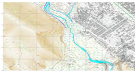
نقشه (۲): تصویر هوایی مسکن مهر کارکنان دولت شهر خرم آباد، منبع: اداره کل مسکن و شهرسازی شهر خرم آباد

گسترده شدن این شهر بر دامنه‌های کوه‌های اطراف وسعت شهر دقیقاً معلوم نبوده. خرم آباد مرکز شهرستان خرم آباد و نیز مرکز استان لرستان است. جمعیت این شهر طبق سرشماری سال ۱۳۸۵ برابر با ۵۲۱.۹۶۴ نفر می‌باشد. در شهر خرم آباد ۵۰۰ واحد مسکونی تحویل داده شده است که حجم نمونه آن ۳۹ واحد مسکونی می‌شود. از موارد لازم به ذکر این است که مجتمع مسکن مهر مورد مطالعه پیاده رو ندارد و دسترسی به مراکز خرید و وسایل نقلیه عمومی امکان‌پذیر نمی‌باشد. در نقشه (۲) مجتمع مسکونی کارکنان دولت شهر خرم آباد مشاهده می‌شود.