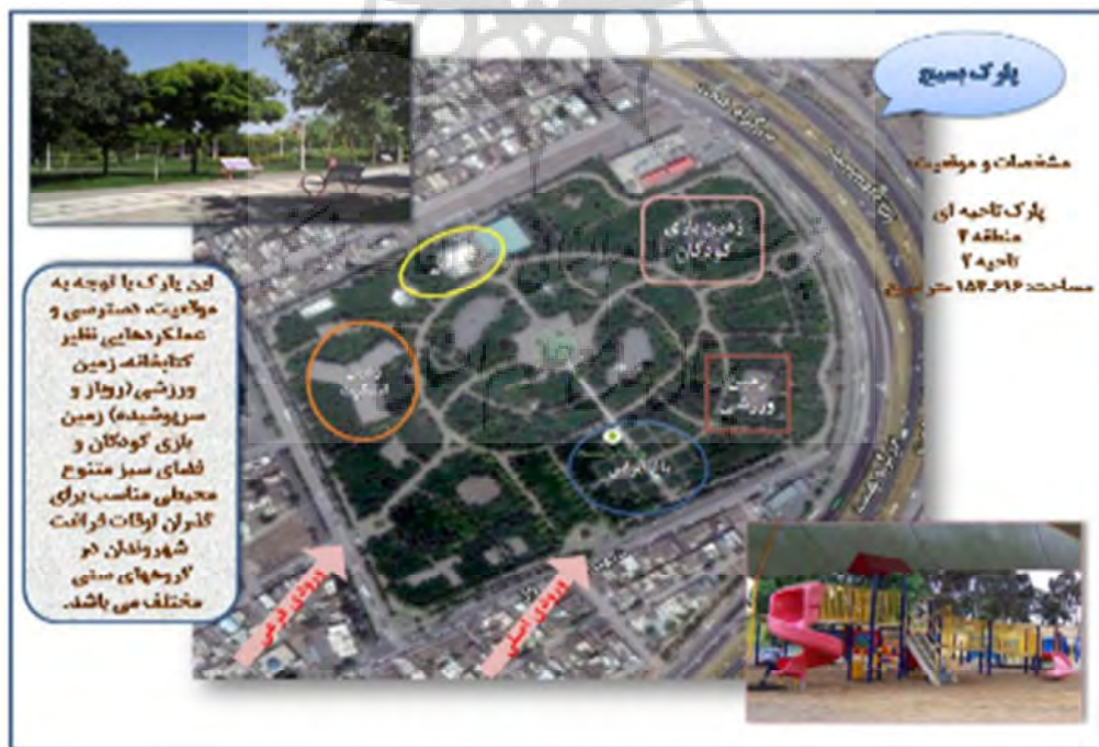
شکل (۲): موقعیت و امکانات پارک بسیج با کاربری گذران اوقات فراغت (نگارندگان)

عرضه امکاناتی برای "مشاهده طبیعت و بهره‌گیری از آواز پرندگان و صدای آبشار و ..." که معمولا برخی از افراد از آن با عنوان "همراهی با طبیعت" یاد می‌کنند، از جمله موضوعاتی است که تاکنون صدها مقاله و کتاب در ارتباط با آن به رشته تحریر درآمده است. به همین دلیل در این تحقیق نیز این انگیزه از جمله دلایل مهم برای بازدید از پارک‌ها (۵۳/۸) عنوان شده است. بدون شک این نیاز یکی از نیازهای