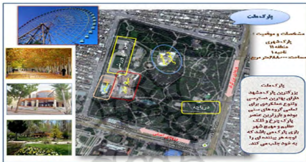
شکل (۵): موقعیت و امکانات پارک ملت با کاربری همراهی با کودکان و عملکردهای ترکیبی (نگارندگان)

همراهی با کودکان، تفکر و تعمق درباره طبیعت و... باشند، را انگیزه اصلی عنوان می‌کنند. به همین دلیل پارکهایی که این انگیزه‌ها را توامان تامین می‌کنند، بیشتر از سایر پارکها مورد بازدید مردم قرار می‌گیرند (شکل شماره ۴). نیازهای عاطفی و نقش وجود عملکردهای تامین کننده آن در پارک‌ها: در بررسی‌های مربوط به پارک‌ها و فضاهای طبیعی موجود در شهر، کمتر محققان به وجود تاسیسات و تجهیزاتی که تامین