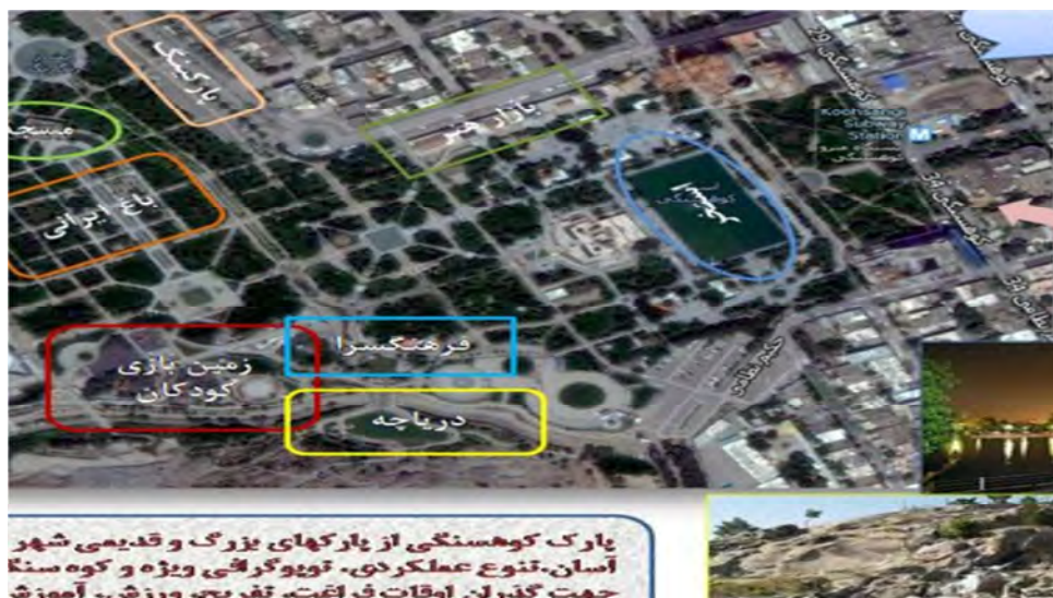
شکل (۴): موقعیت و امکانات پارک کوهسنگی با کاربری خلوت‌گزینی (نگارندگان)

تنهایی و خلوت‌گزینی، برای گروهی از افراد تجدید دیدار دوستان، همراهی و مشارکت در فعالیت‌های گروهی و در واقع سرزندگی و برقراری روابط اجتماعی سازنده و مستمر را زمینه سازی می‌کنند. بر اساس نتایج به دست آمده، پارک ستارخان، نمونه‌ای ایده‌آل در این ارتباط تلقی می‌شود (شکل ۶).