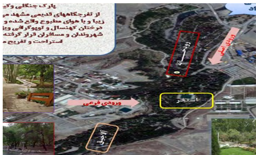
شکل (۳): موقعیت و امکانات پارک وکیل آباد با کاربری همراهی با طبیعت (نگارندگان)

همراهی با کودکان و دادن فرصت به آنها برای ارتباط نزدیک با طبیعت که کمترین مخاطرات انسانی و طبیعی را به همراه داشته باشد، از جمله انگیزه‌هایی بود که شرکت کنندگان در این تحقیق برای مراجعه به پارک‌های مورد بررسی اعلام کرده بودند. به طوری که یافته‌های به دست آمده نشان داد که تقریباً ۱۹/۸ درصد از پاسخ دهندگان، یکی از اهداف اصلی خود از بازدید پارک‌های مورد اشاره را همراهی با کودکان در محیط‌های امن و سالم عنوان نموده بودند. در این شرایط پارک‌ها در کنار سایر عملکردها، ابعاد اجتماعی، تقویت روابط خانوادگی و ارائه شرایط امن و سالم برای حضور و بازی کودکان در اختیار قرار می‌دهند. شرایطی که در شهرهای شلوغ، پرتراکم و آلوده به شدت کمیاب و در مواردی به طور کلی نایاب است.