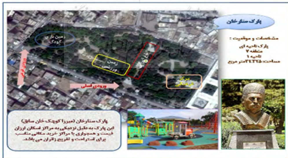
شکل (۶): موقعیت و امکانات پارک ستارخان با کاربری استراحتگاهی و برخی عملکردهای هنری (نگارندگان)