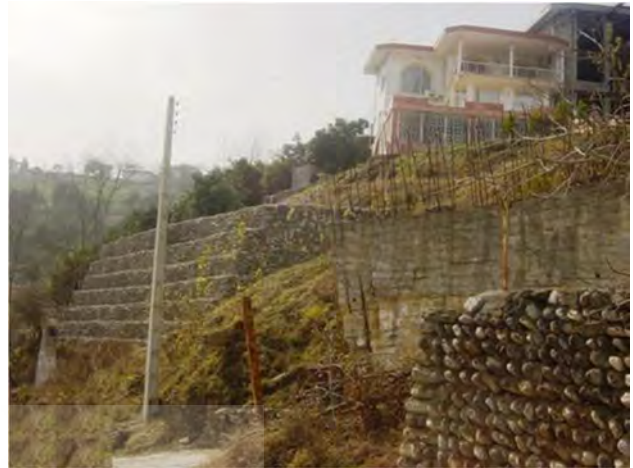
عکس (۲): ناپایداری زمین و اقدامات حفاظتی ساختمان‌ها در روستای لرسانور