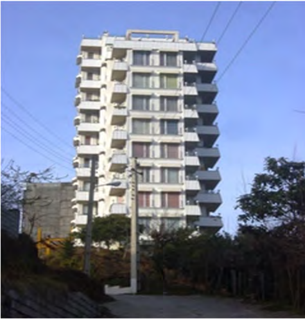
عکس (۳): برج آرامش در روستای ارباکله