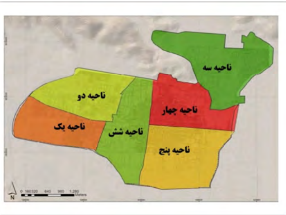
شکل (۳): نواحی شهر نجف آباد