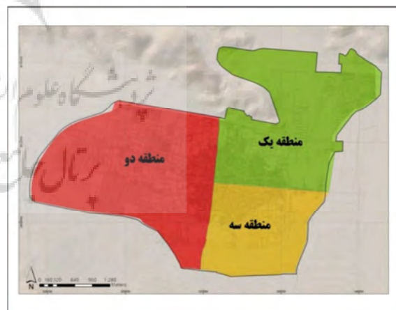
شکل (۲): مناطق سه گانه شهر نجف آباد