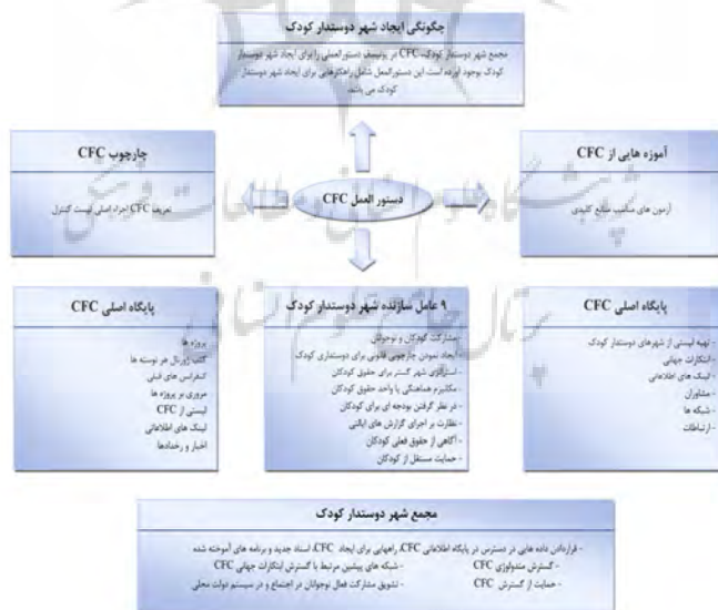
شکل (۱): فرآیند چگونگی ایجاد شهر دوستدار کودک

در ادبیات شهرسازی، سالیان زیادی نیست که این اصطلاح رایج شده است. در اولین کنفرانس هابیتات سازمان ملل در