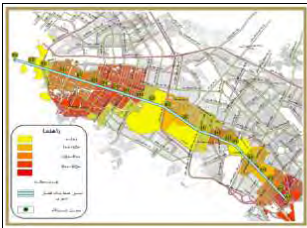
شکل (۵): نقشه تراکم جمعیتی محدوده ایستگاه‌ها