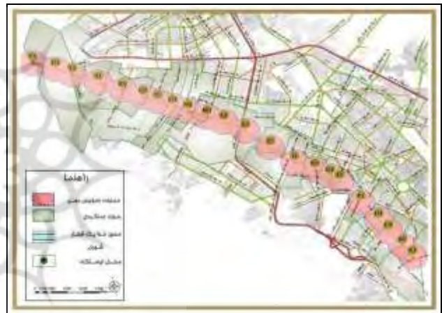
شکل (۱): نقشه موقعیت قرارگیری ایستگاه‌های خط یک قطار شهری در شهر مشهد

تا اواسط دوره قاجاریه، جنگ‌ها کما بیش به صورت تن به تن و با سلاح‌های سرد صورت می‌گرفتند. نیروهای نظامی به دو صورت پیاده و سواره نبرد می‌کرد لذا در نتیجه بهترین دفاع