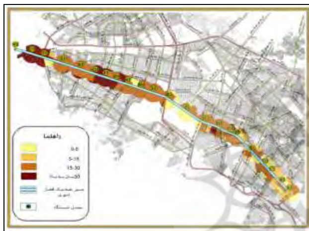
شکل (۷): نقشه قدمت قطعات مجاور ایستگاه‌ها