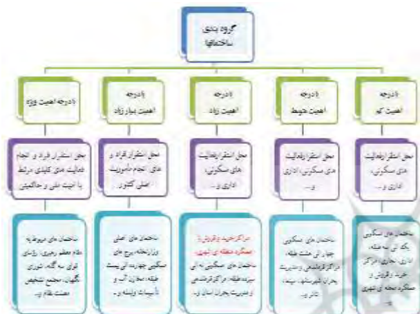
شکل (۲): نمودار گروه‌بندی ساختمان‌ها در مبحث پدافند غیر عامل در مقررات ملی ساختمان (مقررات ملی ساختمان، ۱۳۹۲: ۶ و ۵).

همان‌طور که در شکل (۲) نشان داده شده است مراکز تجاری و خرید در دسته ساختمان‌های با درجه اهمیت زیاد قرار داشته و رعایت مباحث پدافند غیر عامل در این ساختمان‌ها الزامی است.