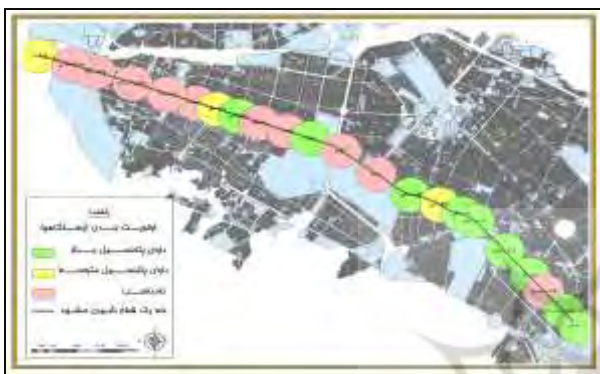
شکل (۹): اولویت بندی ایستگاهها بر اساس امتیاز نهایی

شکل (۹) و جدول (۵) اولویت بندی ایستگاهها در ناحیههای ویژه یک و دو و نامناسب می باشد.