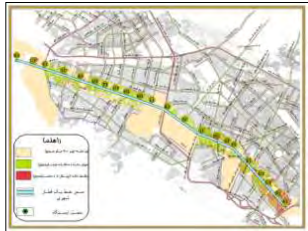
شکل (۴): نقشه دانه بندی قطعات مجاور ایستگاه‌ها (مرجع: نگارندگان)