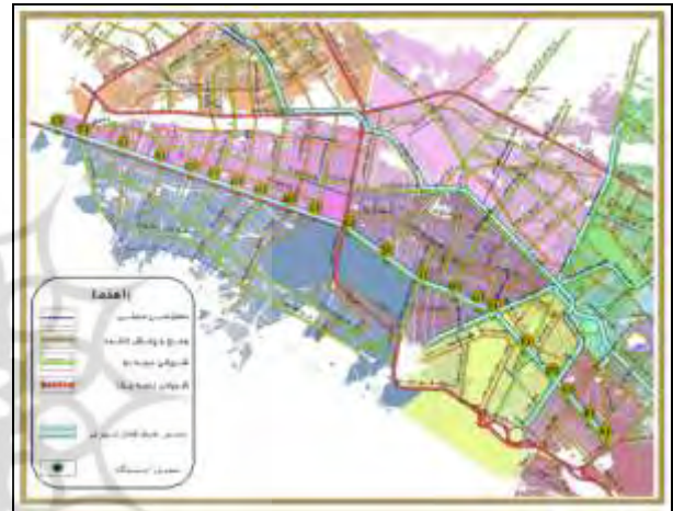
شکل (۶): نقشه نوع دسترسی ایستگاه‌ها (مرجع: نگارندگان)

ماتریس مقایسه دودویی شاخص‌ها باید مجدداً تشکیل شود (پور طاهری؛ ۱۳۷۹: ۸۳). با توجه به اینکه ضریب سازگاری مساوی ۰/۰۹ می‌باشد، سازگاری در قضاوت‌ها مورد قبول است و نیازی به تجدید نظر در قضاوت‌ها نمی‌باشد. سپس اعداد بدست آمده را در زیر معیارهای مختلف به صورت ردیفی با هم جمع کرده تا امتیاز نهایی هر ایستگاه از لحاظ احداث مراکز خرید و تجاری در مجاورت ایستگاه‌های قطار شهری بدست آید. برای مشاهده امتیاز نهایی و اولویت بندی ایستگاه‌های ۲۲ گانه خط یک قطار شهری می‌توان به جدول (۴) مراجعه نمود.