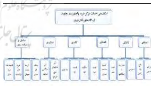
شکل (۳): نمودار معیارهای مؤثر در احداث مراکز تجاری و خرید در مجاورت ایستگاه های قطار شهری (مرجع: نگارندگان)

شناسایی و انتخاب عوامل یا معیارهایی که در امکان سنجی احداث مراکز تجاری و خرید تأثیر گذار می باشند از مراحل مهم مطالعه است. هر قدر عوامل شناسایی شده با واقعیت های زمینی تطابق بیشتری داشته باشد نتایج مکان یابی رضایت بخش تر خواهد بود. عوامل یا معیارهایی که در این پژوهش مورد استفاده قرار می گیرند به شش دسته اصلی یعنی عوامل اجتماعی، ترافیکی، اقتصادی، کالبدی، عملکردی و سیاستی و مدیریتی تقسیم شده اند که هر کدام دارای زیر معیارهای خاص خود می باشند که این معیارها و زیر معیارها را می توانید در نمودار درختی شکل (۳)، مشخص است (وفائی، اکبری، ۱۳۸۸)¹.