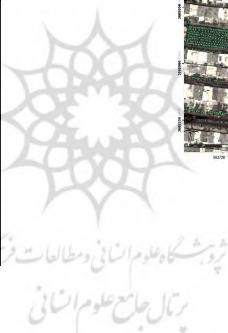
شکل (۳): نمونه‌ای از لایه نقطه‌ای (درختان) در منطقه ۶ (تصویر راست) و جدول اطلاعات خصیصه‌ای آن (تصویر چپ) در محیط GIS

۹ نوع عارضه خطی به طول ۸۵۰۱۰ متر در محدوده‌ی مورد مطالعه شناسایی و برداشت شد.