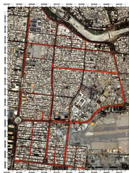
شکل (۴): نمونه‌ای از لایه خطی (پرچین‌ها) در منطقه منطقه ۶ (تصویر راست)، قسمتی از چهارراه نظر (تصویر وسط) و جدول اطلاعات خصیصه‌ای آن (تصویر چپ) در