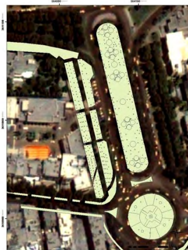
شکل (۵): نمونه‌ای از لایه پلیگونی در منطقه ۶ (تصویر راست) و جدول اطلاعات خصیصه‌ای آن (تصویر چپ) در محیط GIS

برای تفکیک تاج درختان و تعیین موقعیت آنها استفاده کرد. نتایج به دست آمده از پژوهش نشان می‌دهد که تهیه نقشه به روز و برداشت اطلاعات مورد نیاز فضای سبز با استفاده از تصاویر ماهواره‌ای نسبت به سایر روشها کم هزینه تر و سریع تر است و تصویر Quick Bird قابلیت لازم برای برداشت موقعیت مکانی درختان را دارد، به خصوص در مناطقی که تراکم درختان بالا نباشد. در جایی که تاج درختان با یکدیگر تلاقی پیدا کرده تعیین موقعیت درخت با دقت کمتری انجام می‌گیرد در این حالت می‌توان با برداشت زمینی دقت را افزایش داد. در نهایت با استفاده از نقشه‌های رقومی فضای سبز موجود و پردازش آنها محاسبه تعداد درختان، مساحت چمنها و باغچه‌های گل فصلی هر سال به راحتی میسر است، بنابراین می‌توان تصمیمات لازم را برای میزان هزینه نگهداری