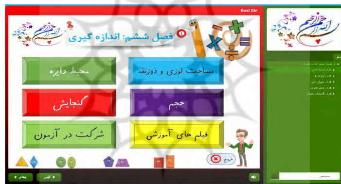
شکل (۲): نمایی از محتوای الکترونیکی آمیخته به طنز ریاضی

متغیر مستقل در این پژوهش یک متغیر آزمایشی است که بر اساس نظریه‌های ارتباطی با تأکید بر نظریه‌های طنز طراحی و تولید گردید و در محیط آموزشی (گروه آزمایشی) به کار گرفته شد. محتوای الکترونیکی آمیخته به طنز توسط متخصصان محتوای الکترونیکی طراحی و تولید گردید. در تولید این محتوا، ضمن رعایت اصول و قواعد حاکم بر تولید محتوای الکترونیکی، تئوری‌ها و کارکردهای طنز نیز مدنظر قرار گرفت و از نظرات اساتید و متخصصان ذیصلاح استفاده گردید. برای طراحی محتوای الکترونیکی (بسته آموزشی) از نسخه الکترونیکی کتاب ریاضی پنجم و راهنمای تدریس جهت ارزیابی اهداف موردنظر استفاده شد. بسته آموزشی موردنظر با استفاده از نرم‌افزارهای Microsoft office، paint، Storyline3 طراحی و تولید شد. از قالب‌های گرافیکی متناسب ریاضی، پویانمایی، ویدئوهای مناسب با سرفصل آموزشی استفاده گردید. محتوای لازم تولید و جهت اعتبار یابی در دسترس متخصصان و اساتید قرار گرفت و پس از تغییرات لازم جهت مداخله در گروه آزمایش نهایی شد. در شکل (۲) نمایی از محتوای الکترونیکی طنز محور ریاضی آورده شده است.