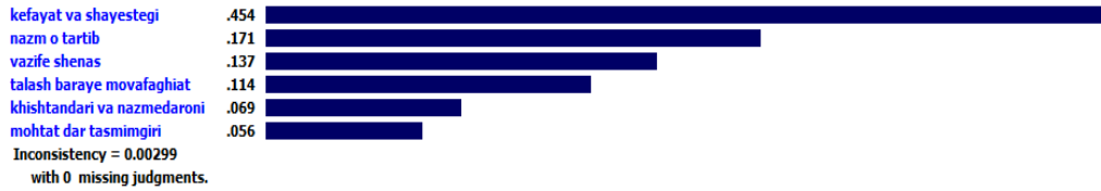
شکل (۲): اولویت‌بندی صفات شخصیتی برای شاخص باوجدان برای مدرسان حسابداری موفق