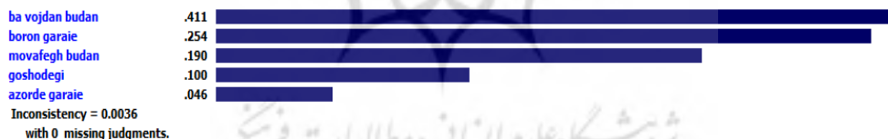
شکل (۱): اولویت‌بندی شاخص‌های اصلی شخصیت برای مدرسان حسابداری موفق

شکل ۱، خروجی حاصل از نرم‌افزار Expert Choice برای اولویت‌بندی شاخص‌های اصلی شخصیت برای مدرس حسابداری موفق را نشان می‌دهد. چنانکه در شکل نمایان است شاخص باوجدان بودن با ضریب ۰/۴۱۱ بالاترین اولویت را دارد و شاخص آزرده‌گرایی با ضریب ۰/۰۴۶ پایین‌ترین اولویت را دارد. نرخ ناسازگاری مقایسات زوجی برابر با ۰/۰۰۳ بوده که کمتر از ۰/۱ است و این نشان از سازگاری مقایسات زوجی و قابل قبول بودن آن است.