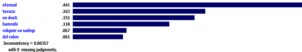
شکل (۴): اولویت‌بندی صفات شخصیتی برای شاخص موافق بودن برای مدرسان حسابداری موفق

شکل ۴، خروجی حاصل از نرم‌افزار Expert Choice برای اولویت‌بندی صفات شخصیتی زیرمجموعه شاخص موافق بودن برای مدرسان حسابداری موفق را نشان می‌دهد. چنان‌که در شکل نمایان است صفت اعتماد با ضریب 0/441 بالاترین اولویت را دارد و صفت دل‌رحم بودن با ضریب 0/061 پایین‌ترین اولویت را دارد. نرخ ناسازگاری مقایسات زوجی برابر با 0/003 بوده که کمتر از 0/1 است و این نشان از سازگاری مقایسات زوجی و قابل قبول بودن آن است.