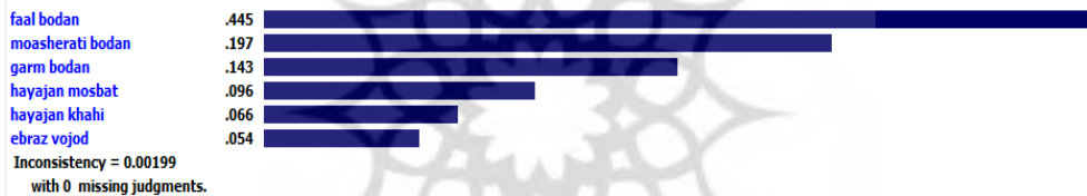
شکل (۳): اولویت‌بندی صفات شخصیتی برای شاخص برون‌گرایی برای مدرسان حسابداری موفق

شکل ۳، خروجی حاصل از نرم‌افزار Expert Choice برای اولویت‌بندی صفات شخصیتی زیرمجموعه شاخص برون‌گرایی برای مدرسان حسابداری موفق را نشان می‌دهد. چنان‌که در شکل نمایان است صفت فعال بودن با ضریب 0/445 بالاترین اولویت را دارد و صفت ابراز وجود با ضریب 0/054 پایین‌ترین اولویت را دارد. نرخ ناسازگاری مقایسات زوجی برابر با 0/001 بوده که کمتر از 0/1 است و این نشان از سازگاری مقایسات زوجی و قابل قبول بودن آن است.