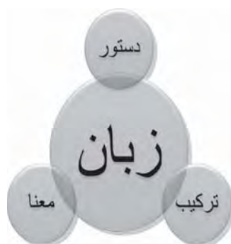
شکل ۳- مدل ساختار کلمات و هسته مرکزی واژگان

بنابر شکل بالا، زبان را می‌توان پیکره اصلی برای نظام زبانی و دربرگیرنده تمامی مسائل مربوط به واژگان دانست که این پیکره با وجود آشنایی با دو یا چند زبان، دچار خلل و کاستی می‌شود. در هر صورت با وجود چنین مسائلی، عبارات و جملات شخص دو زبانه کوتاه‌تر است و دارای کلمات کمتری است. تا آنجا که وی به بیان جملات ناقص روی می‌آورد. بررسی احصائی مربوط به چهار جلد شوقیات، بیانگر آن است که شاعر ۱۴۷ بار (که ۵۱٪ است) جملات غیر تامه استفاده کرده است؛ وی از جملات معطوف و مرکب کمتری استفاده کرده است؛ حدود ۱۱۲ بار (که ۳۸٪ در کل مجموعه شعری است). با توجه به این مقوله، بافت زبان شعری شاعر دو زبانه سست و ضعیف می‌شود و رفته رفته خلاقیت و نوآوری درونی شاعر را می‌کشد و آثاری ادبی که چنین شاعری پدید می‌آورد، از نظر زبانی ارزش چندانی ندارند.