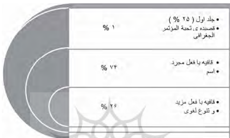
جدول ۲- ارائهٔ آماری در تحلیل یک سروده در دیوان شوقیات

۱) قافیه با افعال مجرد و اسم، ۷۴٪ است که نمایانندهٔ عدم پویایی لغوی شاعر است. ۲) قافیه با افعال مزید و رباعی و یا تنوع در مفردات زبانی، ۲۶٪ است. با توجه به این که افعال مزید سبب گسترش معانی و مانایی آن در ذهن مخاطب می‌شود، در اینجا شاعر با بکارگیری افعال مجرد و یا اسم در قافیه، به جمود و عدم تجدید و نوآوری می‌گراید. چون چنین است باید به سخن زبانشناسان تن داد که گفته‌اند: فقدان تنوع زبانی به انقراض زبانی می‌انجامد (کریستال، ۲۰۰۶: ۷۰).