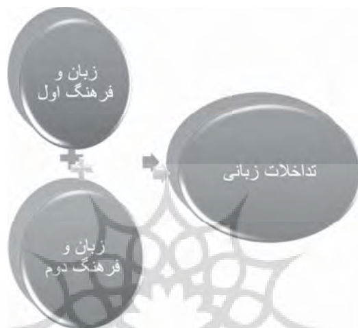
شکل ۴- ارتباط دهی زبان‌ها و فرهنگ‌ها و اجتناب ناپذیری از آن

فرهنگی - هویتی متفاوت زیسته است، در کاربست ترکیبات و جملات وی آشفتگی دیده می‌شود (Lado، ۱۹۵۷: ۵۹). این مسئله را می‌توان با شکل زیر نمایش داد: