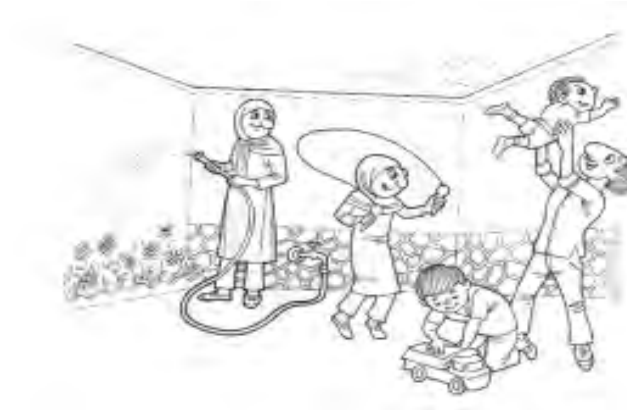
شکل ۱. تصویر تزئینی (برگرفته از کتاب Book 1 ، ۱۳۸۶: ۸)