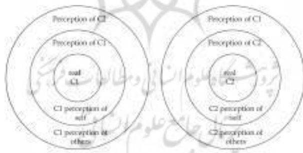
شکل ۲: رابطه بین دو فرهنگ و فهم متقابل آنها از یکدیگر

چشم‌اندازهای متفاوتی از یک فرهنگ را برای زبان‌آموزان ارائه کنند. این مهم نیست که آنها نمی‌توانند تمام جنبه‌های یک فرهنگ را آموزش دهند، مهم این است که بتوانند چیزی بر آگاهی‌های بینافرهنگی زبان‌آموزان بیفزایند. علاوه بر این، مدرسان زبان باید به این مسأله واقف باشند که علی‌رغم تأکید تلفیق فرهنگ در تدریس زبان، نباید فرهنگ خودی نادیده انگاشته شود. بلکه در کنار یادآوری غنای فرهنگ خودی، باید به ارائه مسائل فرهنگ بیگانه پرداخته شود. به بیان دیگر، هدف از تدریس فرهنگ یک زبان بیگانه این نیست که زبان‌آموز فرهنگ خود را کنار بگذارد و فرهنگ بیگانه را به عنوان یک الگوی کامل بپذیرد به عبارت دیگر، در اینجا نفی خود و پذیرش دیگری مطرح نیست. برعکس، این آگاهی همانند یک محافظ در برابر اثرات منفی و مخرب احتمالی ناشی از مواجهه شخصی فرد با هنجارهایی متفاوت با فرهنگ خودش عمل می‌کند و به فرد کمک می‌کند تا تفاوت‌های موجود بین دو فرهنگ را دریابد و آنها را بپذیرد و از آن برای پیشرفت یادگیری زبان بیگانه بهره ببرد. درحقیقت وجود شباهت‌ها و تفاوت‌های بین زبان‌ها، درک ما از جهان را وسعت می‌بخشد که می‌توان آن را به صورت شماتیک (شکل ۲) نشان داد. در این تصویر، فرهنگ مبدأ با (C 1 ) و فرهنگ مقصد با (C 2 ) نشان داده شده است. این دوایر همگرا در واقع نشان دهنده رابطه بین دو فرهنگ و فهم متقابل آنها از یکدیگر را به تصویر می‌کشد.