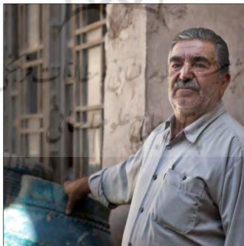
تصویر (۱): زنده‌یاد استادکار بهرام الیکی

اخلاق در هر حرفه‌ای، تأثیر چشمگیری بر فعالیت‌ها و نتایج و اعتلای آن حرف دارد. معماری از جمله هنرهای سنتی است که به سبب ماهیت شغلی و حرفه‌ای خاصش، نیازمند تعهدات اخلاقی است (نازی‌دیزجی و دیگران، ۱۳۸۹، ص ۴). معماری، حرفه‌ای است که با حل مشکلات و اعتلای فضای زندگی مرتبط با اخلاق و حقوق انسانی پیوند دارد. معمار با طراحی مناسب و اصولی و اخلاق‌مند می‌تواند راه را برای رسیدن به این مهم هموار سازد. از آن‌رو که حسن مخلوق در گرو حسن خالق است، اندیشه و روح معمار، در معماری به ظهور می‌رسد (ندیمی، ۱۳۸۶، ص ۱۲۸؛ پیشوایی و همکاران، ۱۳۹۲، ص ۱۸).