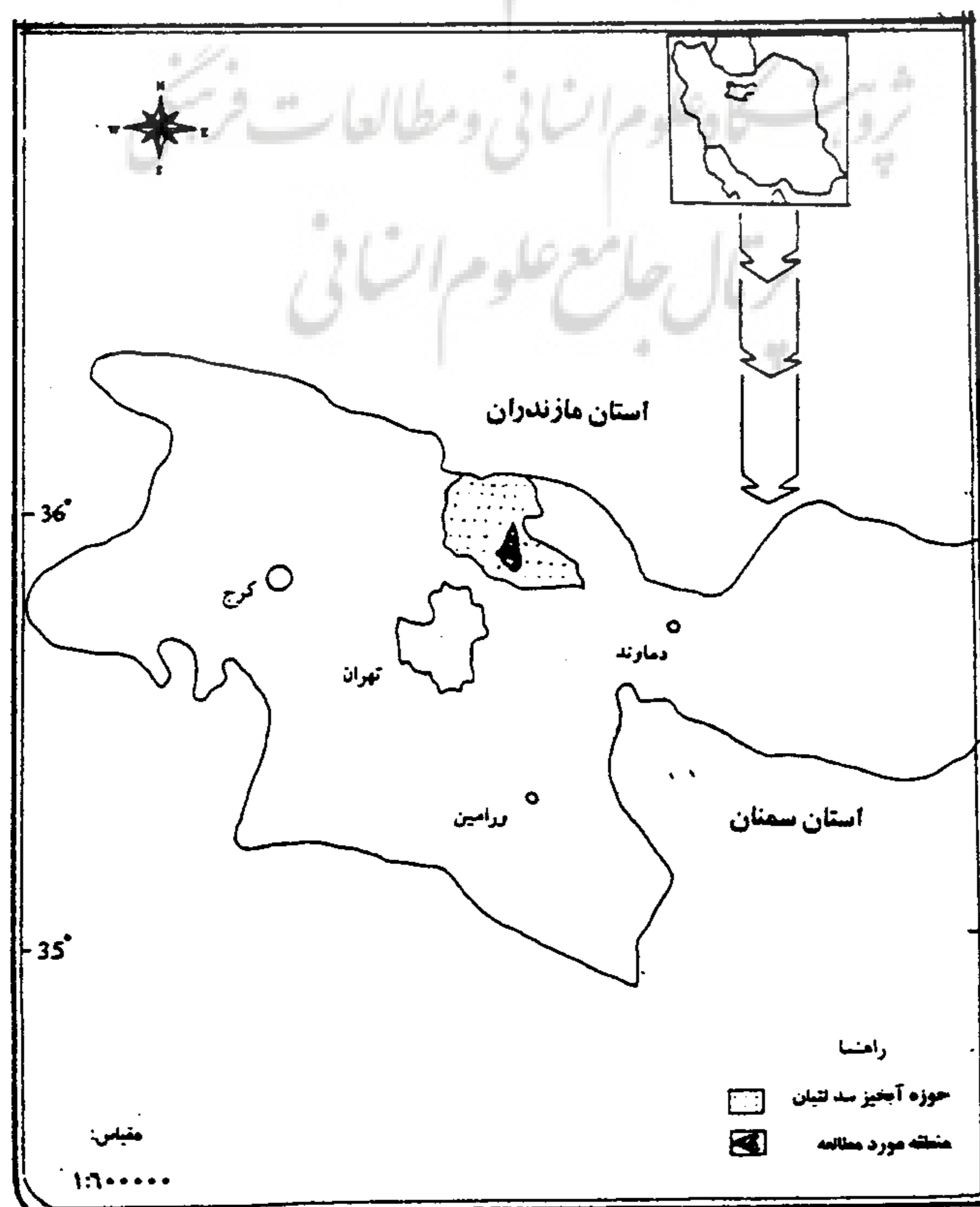
شکل ۱- نقشه موقعیت جغرافیایی منطقه مورد مطالعه

تمامی آبراهه‌های حوضه از نوع فصلی و موقتی بوده و طول بزرگترین آبراهه 8/74 کیلومتر و شیب آن 11/96 درصد می‌باشد. از نظر ارتفاعی، حداکثر و حداقل ارتفاع این حوضه به ترتیب 3700 متر در بلندیهای شمالی و 1750 متر در نقطه خروجی آن بوده و با ارتفاع متوسط وزنی 2346 متر منطقه‌ای کوهستانی بشمار می‌رود.