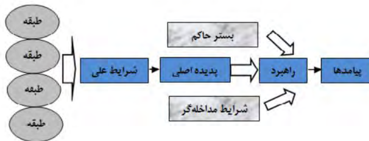
شکل ۱. مدل پارادایمی کدگذاری محوری (Bazargan, 2018).