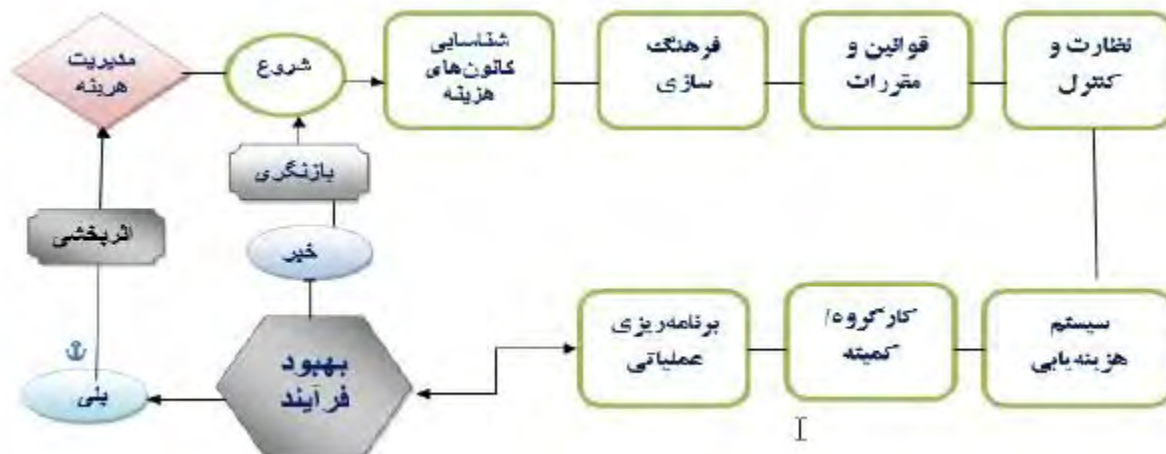
شکل (۲): مدل فرآیند محور مدیریت هزینه ها در بیمارستان بر اساس مفاهیم استخراجی