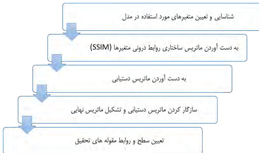
شکل ۱- مراحل اجرای روش مدلسازی ساختاری-تفسیری

در نهایت تحلیل قدرت نفوذ و وابستگی (MICMAC) انجام شد و نمودار مربوطه برای متغیرهای مورد مطالعه ارائه گردید.