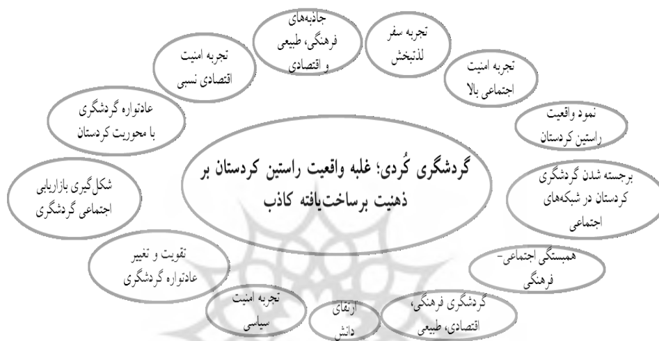
شکل ۲: مقوله هسته پدیده نمود گردشگری کُردی

و برخورد با جامعه میزبان هستند. از یک سو تحت تأثیر کلیشه‌های غالب از قدیم شکل گرفته، کردها را به سان مابقی ایرانیان نمی‌پندارند و از سوی دیگر هنگام مواجهه با واقعیت‌های عینی موجود درمی‌یابند که آن کلیشه‌ها اعتبار چندانی هم ندارند و ناگزیر باید به میانجی ایماژهایی جدید با این جامعه تعامل کنند.