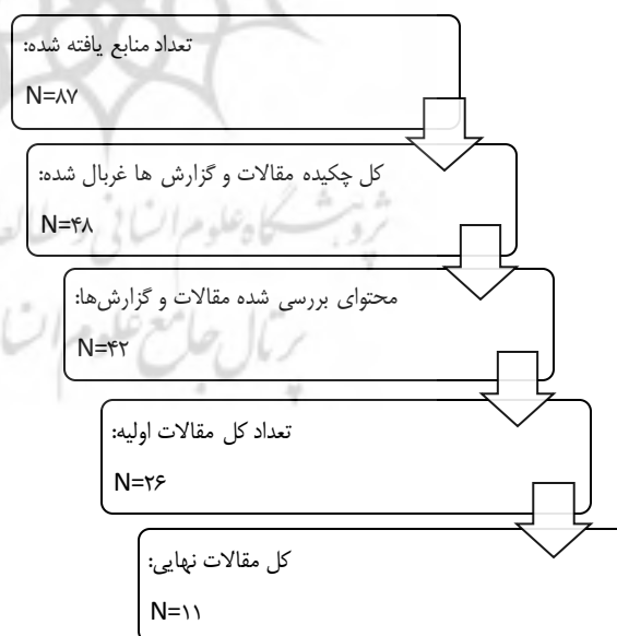
شکل ۱. فرآیند گزینش مقالات و گزارش‌های منتخب

مرحله سوم، جستجو و انتخاب مقالات و گزارش‌های علمی مرتبط: در این گام پژوهشگر پس از جستجو و دریافت مستندات، مشخص می‌کند که آیا مقالات یافت شده متناسب با سؤال پژوهش است یا خیر. بنابراین مقالات مورد نظر و مرتبط چندین بار مورد بازبینی قرار می‌گیرد. در نهایت پژوهشگر در هر بازبینی تعدادی از مقالات را رد می‌کند. در پژوهش حاضر پس از فیلتر مقالات بر اساس رسیدن به اشباع نظری تعداد نهایی مقاله‌ها به ۱۱ عدد رسید.