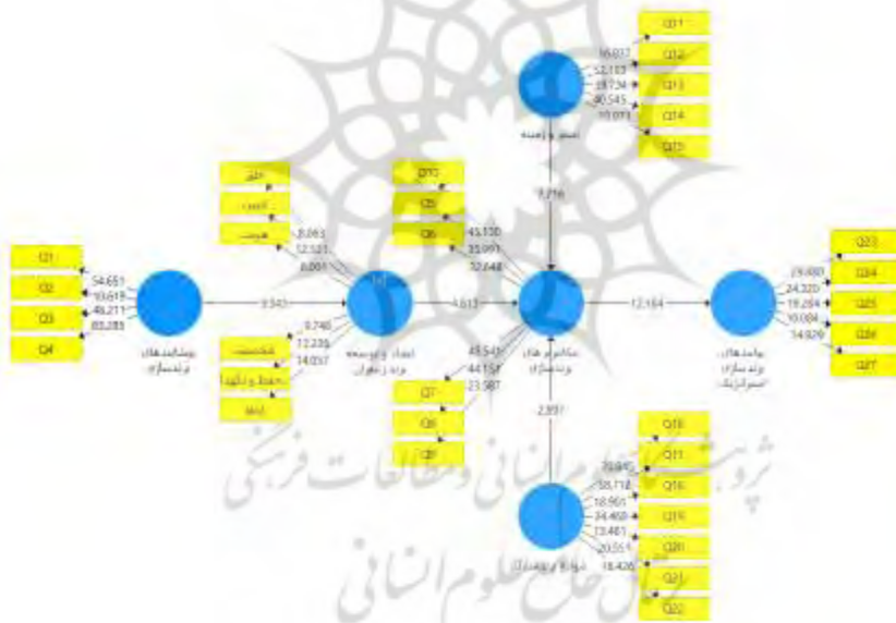
شکل ۳. مدل اجرایی در حالت ضرایب معناداری

بررسی برازش مدل پیشنهادی طی سه مرحله انجام می‌شود؛ در ابتدا بررسی مدل بیرونی (یا مدل اندازه‌گیری) و سپس در مرحله دوم به بررسی مدل درونی (یا مدل ساختاری) و مرحله آخر به بررسی مدل کلی پژوهش اختصاص دارد. این مراحل در جدول ۴ نشان داده شده است.