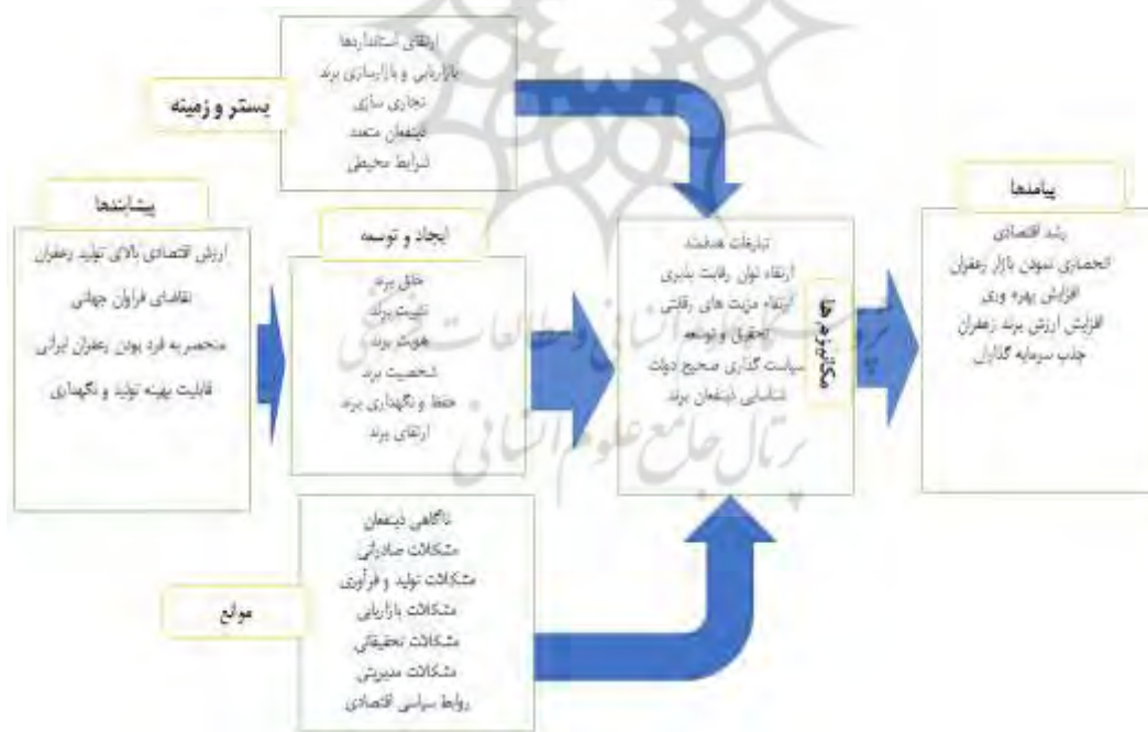
شکل ۱. مدل نظری پژوهش (مدل برندسازی استراتژیک در صنعت زعفران). (منبع: یافته‌های پژوهشگر)

با استفاده از نتایج کدگذاری باز، محوری و انتخابی مدل برندسازی استراتژیک در صنعت زعفران بر اساس پارادیم شش‌گانه به شرح شکل ۱ است.