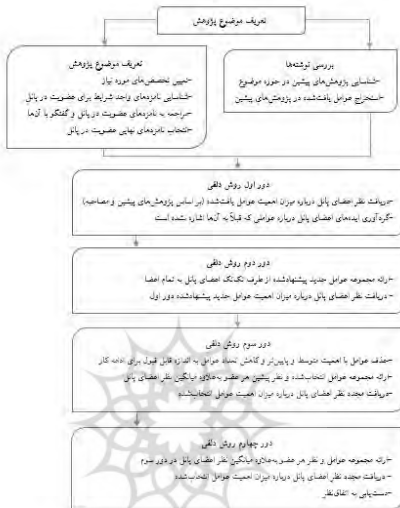
شکل شماره (۱): الگوریتم روش دلفی