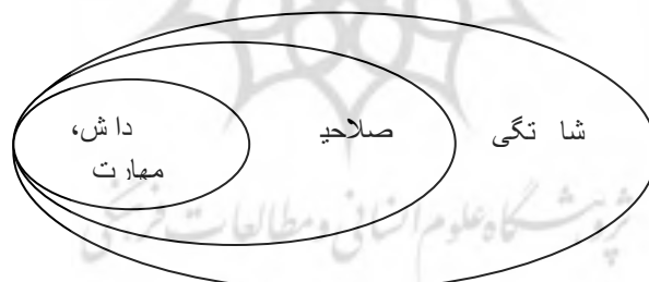
شکل ۱. رابطه بین دانش، توانایی‌ها، صلاحیت‌ها و شایستگی‌ها (Fayazi, 2013)

Armstrong (2013) شایستگی را مجموعه دانش، مهارت‌ها، خصوصیات شخصیتی، علائق، تجربه‌ها و توانمندی‌های مرتبط با شغل می‌داند که دارنده آن‌ها را قادر می‌سازد در سطحی بالاتر از حد متوسط به ایفای مسئولیت بپردازد. شایستگی الگویی را ارائه می‌کند که نشان‌دهنده فرد یا عملکرد برتر در شغل محوله است (Faslami, Rayi, Farzinvasb and Barghi, 2013). از نظر McClelland (2014) شایستگی عبارت است از ترکیبی از انگیزه‌ها، ویژگی‌ها، خودآنگاری‌ها، نگرش‌ها با ارزش‌ها، دانش محتوایی و با مهارت‌های رفتاری شناختی، و می‌تواند برای تمایز قائل شدن بین کارکنان عالی و متوسط نشان داده شود. (Lucia, and Lepsinger 2015) شایستگی را، گروهی از دانش، مهارت و نگرش‌های مرتبط می‌دانند که بر شغل یک فرد اثر می‌گذارند و با عملکرد شغلی همبستگی دارند.