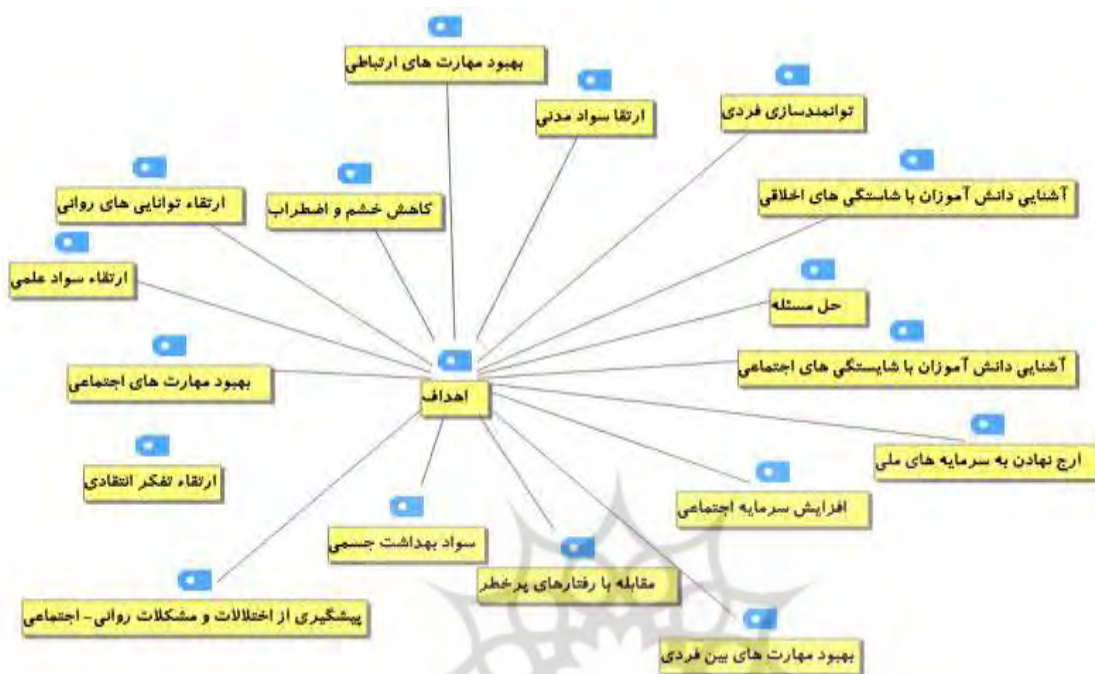
شکل ۱. اهداف آموزش مهارت‌های زندگی از دیدگاه صاحب‌نظران