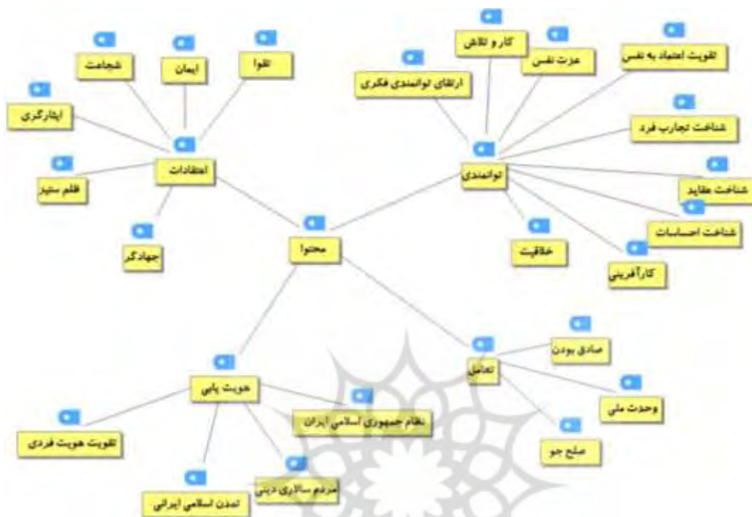
شکل ۲. محتوا آموزش مهارت‌های زندگی از دیدگاه صاحب‌نظران