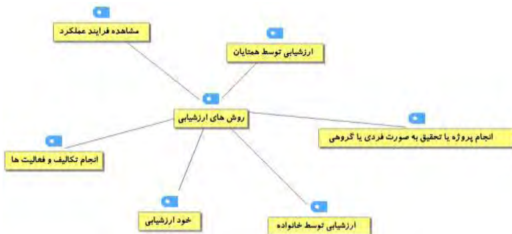
شکل ۴. روش‌های ارزشیابی مهارت‌های زندگی از دیدگاه صاحب‌نظران

در ادامه مدل چهار سطحی آموزش مهارت‌های زندگی در قالب اهداف، محتوا، روش‌های آموزش و روش‌های ارزشیابی ارائه می‌شود. لازم به ذکر است این مرحله آخرین مرحله از فرایند تحلیل کیفی می‌باشد و در این مرحله ارتباط بین طبقات مشخص می‌گردد. در فرایند تحلیل کیفی به این مرحله از پژوهش تحلیل گزینشی گفته می‌شود.