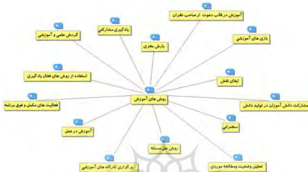
شکل ۳. روش های آموزش مهارت های زندگی از دیدگاه صاحب نظران