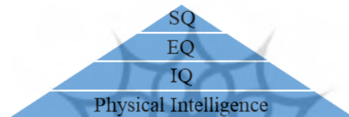
شکل ۱: رابطه هوش‌ها با یکدیگر، منبع: (Wigglesworth, 2004,14)

بروز می‌کند. ج) افرادی باهوش معنوی بالا، ظرفیت تعالی را داشته و تمایل به هشیاری دارند. این مفهوم در فرهنگ‌های مختلف به‌عنوان عشق، خردمندی ۱ و خدمت مطرح است (Vaughan, 2012). بر اساس ترتیب رشد (Wigglesworth, 2004) چهار نوع هوش بدنی، شناختی، هیجانی و معنوی را، مطرح نموده است. این الگو بر اساس این دیدگاه است که کودکان ابتدا بر بدن خودکنترل پیدا می‌کنند (هوش بدنی ۲ )، سپس مهارت‌های زبانی و مفهومی (هوش‌بهر ۳ ) خود را گسترش می‌دهند. این هوش در فعالیت‌های مدرسه‌ای کودک مطرح است. هوش هیجانی ۴ هنگامی مطرح می‌گردد که افراد علاقه‌مند به گسترش روابط خود با دیگران باشند. درنهایت، هوش معنوی زمانی خودنمایی می‌کند که فرد به دنبال معنای ۵ مسائل می‌گردد و سؤالاتی مانند «آیا این، همه آن چیزی است که وجود دارد؟» ۶ را مطرح می‌نماید.