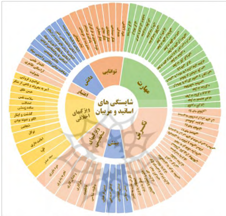
شکل ۲. الگوی شایستگی‌های استادان و مربیان مبتنی بر بیانات امام خمینی (ره) و مقام معظم رهبری (مدظله‌العالی)

در نهایت، الگوی شایستگی‌های استادان و مربیان سازمانی مبتنی بر بیانات حضرت امام خمینی (ره) و مقام معظم رهبری در قالب شکل زیر ارائه شده است.