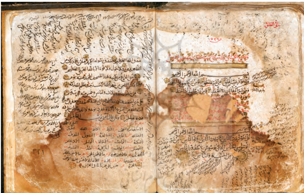
▲ تصویر ۸: انجامهٔ نسخهٔ مجلس شورای اسلامی (کتابت محمد بن جعفر بن بنجیر در رجب ۵۸۳ هجری)