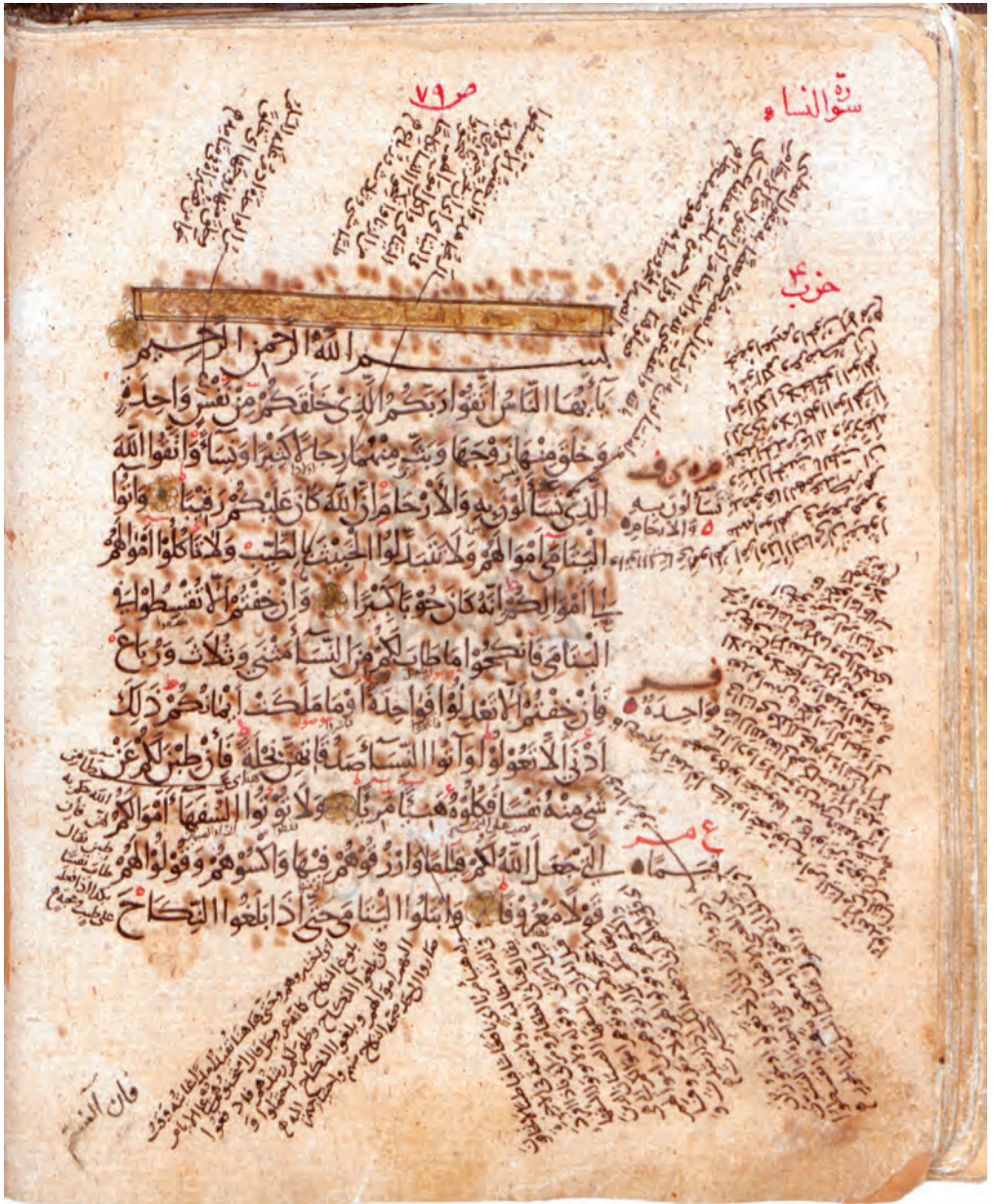
▲ تصویر ۵: آغاز سوره نساء در نسخه مجلس شورای اسلامی