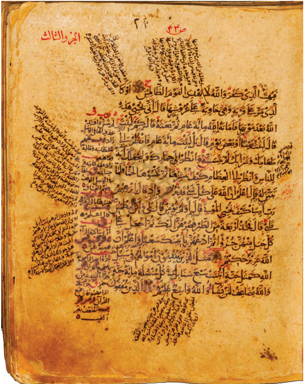
▲ تصویر ۳: نسخه مجلس شورای اسلامی، آیات بقره، ۲۵۹-۲۶۱