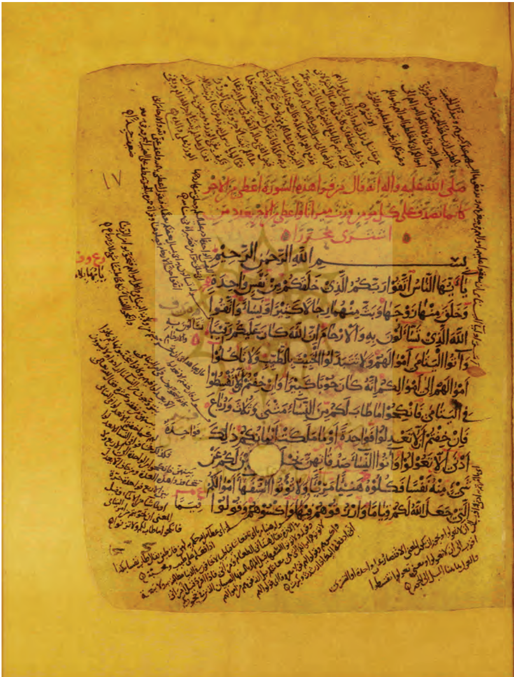
▲ تصویر ۶: آغاز سوره نساء در نسخه آستان قدس رضوی