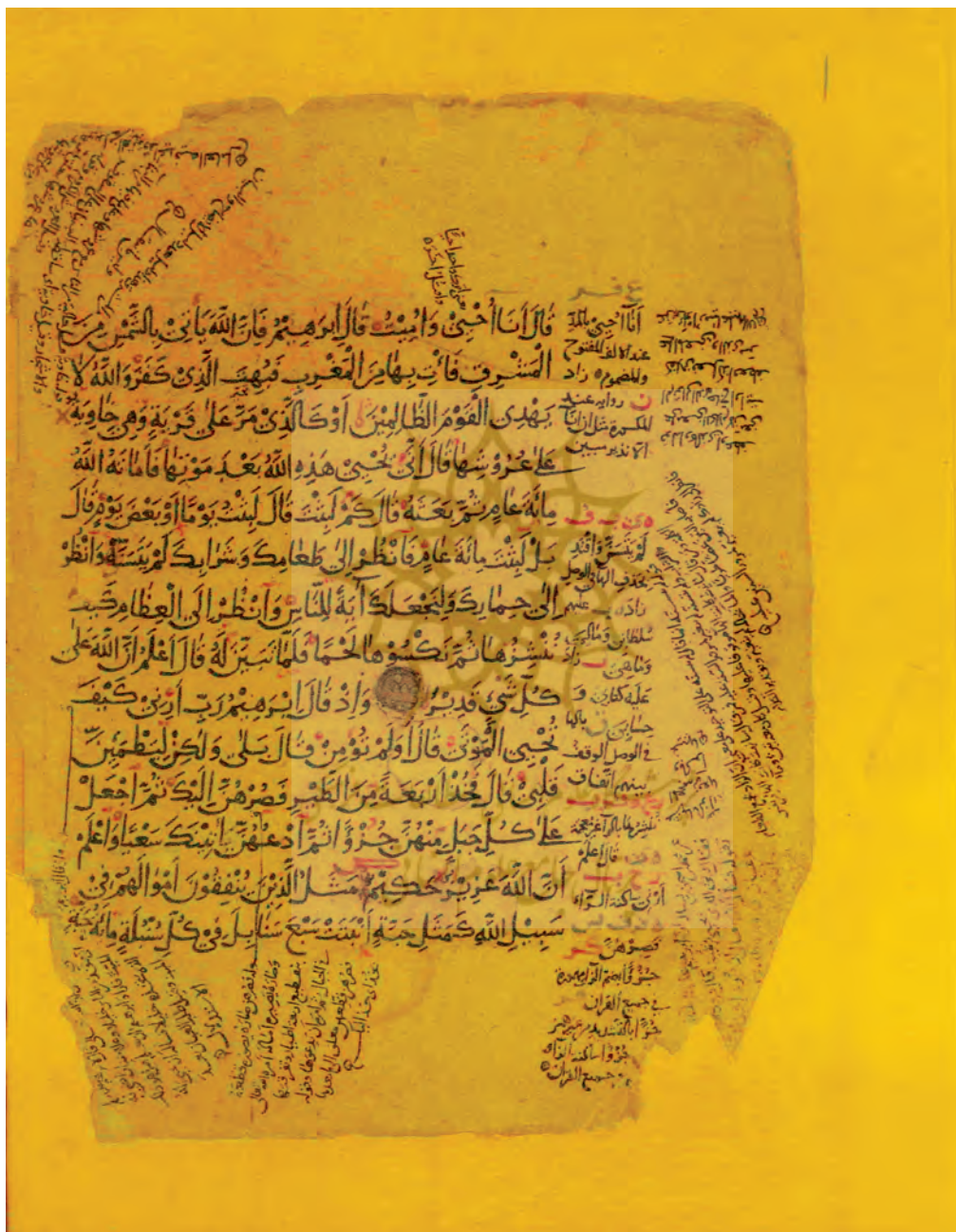
▲ تصویر ۴: نسخه آستان قدس رضوی، آیات بقره، ۲۵۹-۲۶۱