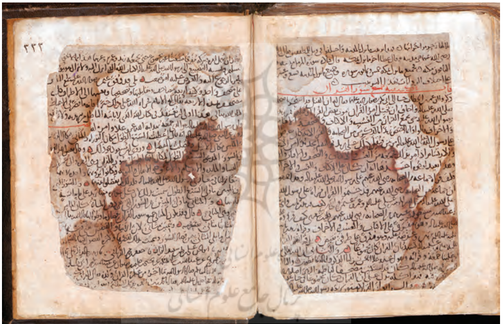
▲ تصویر ۹: نقد راوندی بر روایت رسمی اهل سنت از جمع قرآن (نسخه ۴۱۲۹ مجلس شورای اسلامی)