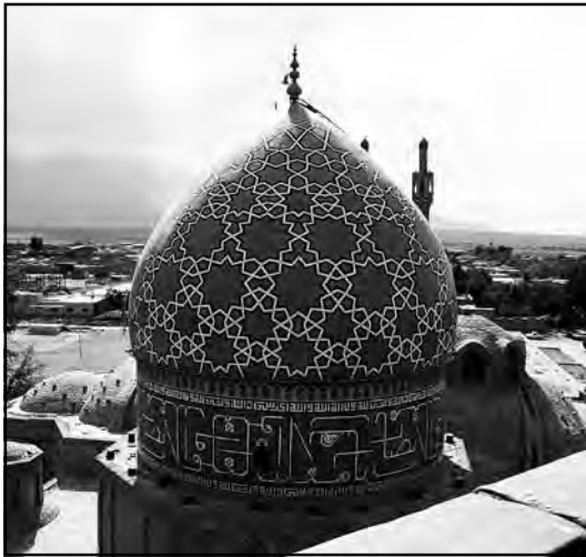
آرامگاه شاه نعمت‌الله‌ولی، دوره صفوی، ماهان

موجود میشود، همان هنرمند متعالی است که به مقام کن نایل شده است زیرا در رویکرد صدرایی بهشت و هنر مشابهتها و سنخیت‌های حیرت‌آور و اعجاب‌انگیزی دارند، چرا که خمیرمایه هر دوی آنها همانا خیال فعال خلاق است. بدیگر سخن، این همان هنرمند بهره‌مند از خیال خلاق است که بلطف نقش آفرینی قوه خیالش صور بهشتی را همانطور در ذهن و دلش متصور میشود که صور هنری را، از همین جاست که «ملاصدرا هنر را، بشرط آنکه هنرمند و مخاطب، هنر را در صورت و تصویر زمینگیرش نکند و از زمین صورت به آسمان معنا پروازشان دهد، کمال میداند و صورت باطنش را نیز مرتبه‌یی از بهشت» ۱۹ . در حقیقت، در منظر صدرایی هنر در نشئه دنیای محسوس که ریشه در توان خلق صور قوه خیال دارد، در واقع مرتبه بسیار ضعیفی از نحوه وجود آدمی در