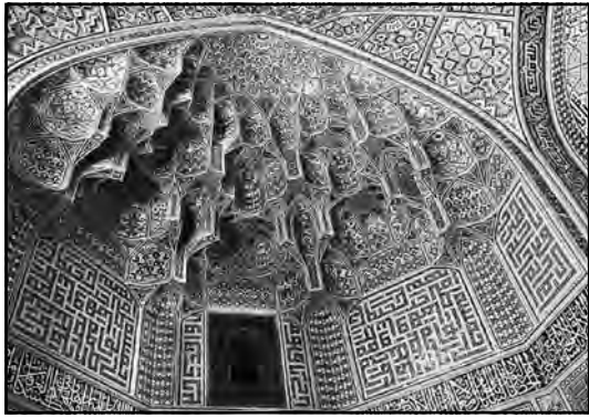
مدرسه چهار باغ، اصفهان، دوره صفوی

است که قادر است تمامی حقایق – اعم از معقول و محسوس و مخیل – را در ذات خود تصویر نموده و صورتهای غایب از حواس را در عالم خود، بدون مشارکت ماده، انشاء و ایجاد نماید. این همان قاعده «النفس فی وحدتها کل القوی» است ۳ که یکی از اصول اساسی حکمت و فلسفه ملاصدرا بشمار میرود. نکته آخر درباره بسط مفهوم خیال در حکمت متعالیه اینکه ملاصدرا – همانند سهروردی و جمیع عرفا – حد نهایی استعلای خیال را مقام «کن» میدانند، زیرا از آنجاییکه در دیدگاه او خداوند انسان را چه از نظر ذات و چه از نظر اسماء و صفات و افعال و رفتار مثال خویش قرار داده، طبیعی است که انسان متعالی بمحض اینکه چیزی اراده کند آن چیز صورت وجود پیدا کرده و موجود به وجود ذهنی شود تا از این طریق بتوان به مفهوم منطقی آن، عالم ذهن را عالم «کن فیکون» نیز نامید. لازم بذکر است که خود