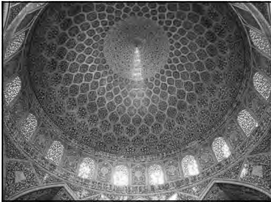
زیر گنبد مسجد شیخ لطف الله، اصفهان، دوره صفوی (پیرنیا، سبکشناسی معماری ایرانی، ص ۱۶)

کلی در قالب محسوسات ظهور می یابند. درباره خیال مطلق نیز باید گفت از دید عرفا این نحو از تخیل به تصور اعیان ثبوتیه میپردازد، آنهم در حال عدمشان. بیان دیگر، در این مرحله آدمی بدنبال درک اموریست که منشأ و سرچشمه تمامی امور محسوس و معقول بوده و از طرفی خود نیز به مفهوم کلی آن هنوز وجود نیافته‌اند.