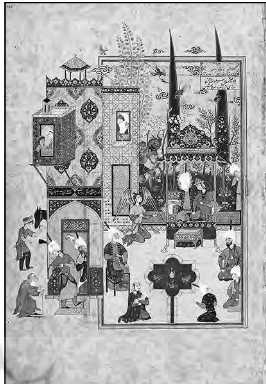
سلیمان و بلقیس باهم نشسته و صحبت میکنند هفت اورنگ جامی، دوره صفوی

بدیگر سخن، در این دوره است که هنرمند با استفاده از خیال خلاق خود بهشت یا همان دنیای معقول را در کوشک و باغ ایرانی متجلی می‌سازد و هر کدام از عناصری که برای خلق فضاهای مذکور ایجاد میکند در واقع نشانی است از آن عالم. در حقیقت، هنرمند معمار گوشه‌ی از دنیای معقول را در این عالم خاکی تصویر میکند و از تمام عناصر مادی این دنیا بهره میگیرد تا لحظه‌ی از آن دنیا را بر ما آشکار کند و ۲۳. نصر، «عالم خیال و مفهوم فضا در مینیاتور ایرانی»، ص ۷۹-۸۶. ۲۴. ملاصدرا، الحکمة المتعالیه فی الأسفار العقلیه الأربعة، ج ۷، ص ۱۹۵-۱۹۴. ۲۵. بورکهارت، مبانی هنر اسلامی، ص ۱۷۵.