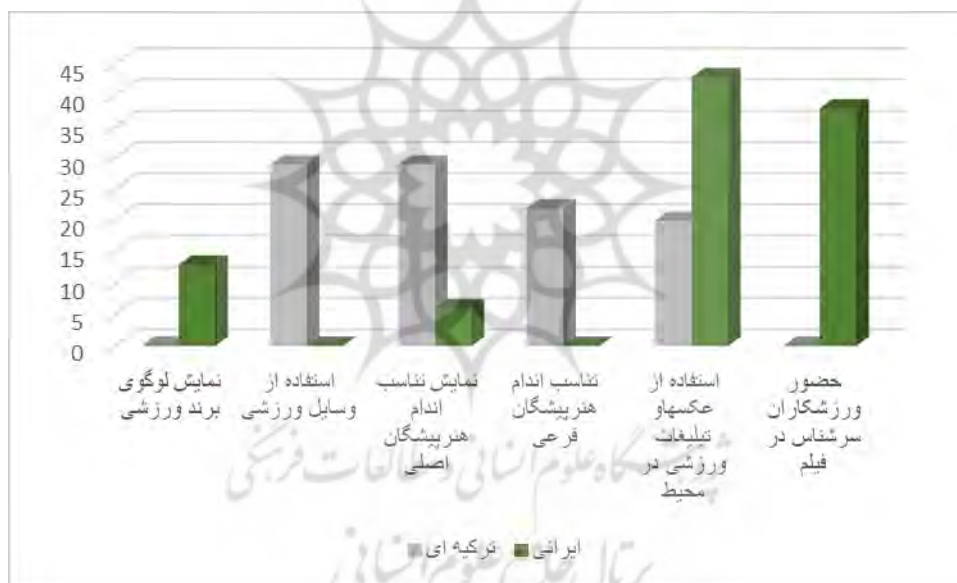
نمودار ۱. مقایسه سریال‌های ایرانی و ترکیه‌ای از نظر مؤلفه‌های تحقیق

نمودار ۱ نمایش خروجی‌های تحقیق در چارچوبی مقایسه‌ای است. همان‌طور که در این نمودار دیده می‌شود. در فیلمهای ترکیه ای علائم بصری مربوط به فعالیت ورزشی در قالب کاربرد وسایل و تناسب اندام هنرپیشگان اصلی و فرعی بیش از فیلمهای ایرانی مورد توجه است و در مقابل، در فیلمهای ایرانی بیشتر به نمایش تبلیغات، لوگوی محصولات ورزشی و حضور ورزشکاران در هیئت بازیگران بیشتر مورد توجه است.