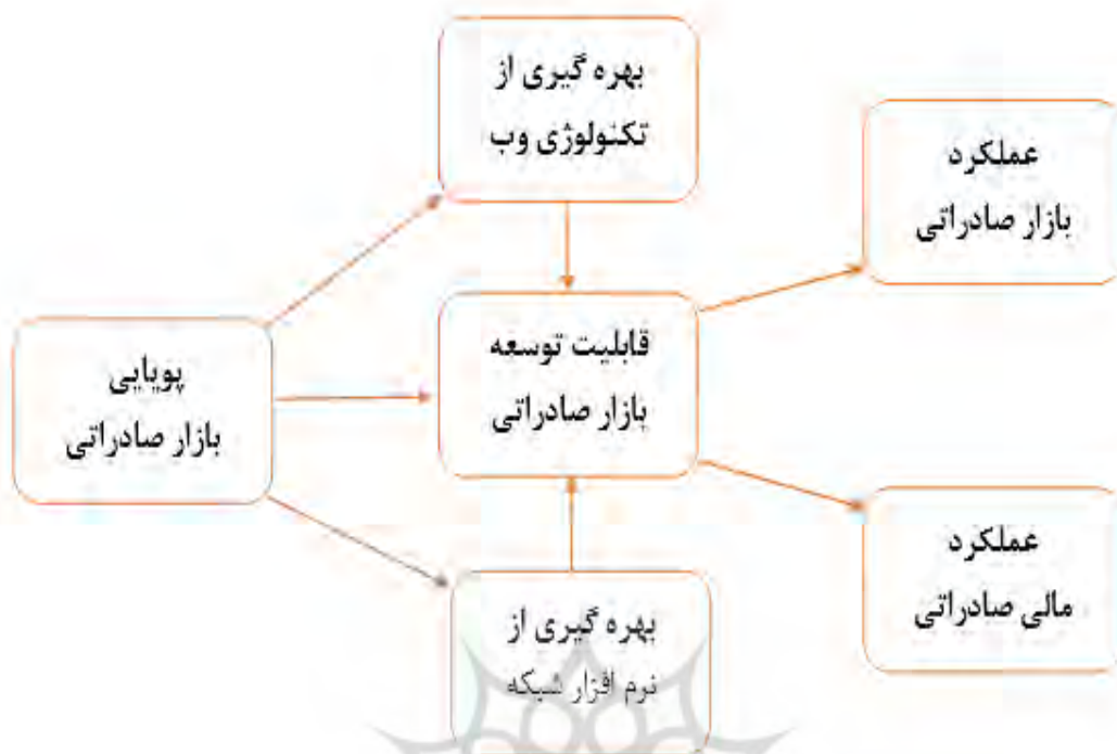
شکل ۲-۱۳-مدل نظری تحقیق برگرفته از تحقیق راسلا و نورمنگروچ (۲۰۲۰)

پژوهشگاه علوم انسانی و مطالعات فرهنگی رتال جامع علوم انسانی