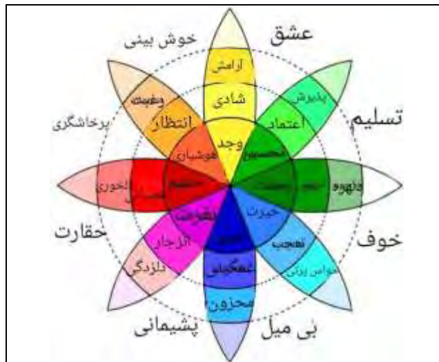
شکل ۱. چرخ هیجان از نظر پلوچیک