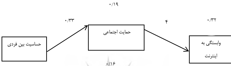
شکل ۲. نمودار مسیرهای مدل برازش یافته با ضرایب استاندارد

(NFI)، شاخص نیکویی برازش ( GFI=0/91 ) و جذر میانگین مجذورات خطای تقریب ( 0/07 )، RMSEA= حاصل گردیده است. شایسته است مطرح نماییم که هر چه اندازه سه شاخص GFI و NFI ، CFI به یک نزدیک تر باشند بیانگر پرازش مطلوب تر مدل است. نیز جذر میانگین مجذورات خطای تقریب ( RMSEA ) زیر 0/08 کاملاً مطلوب است که در این مطالعه حاصل گردیده است. بر اساس این شاخص‌ها، می‌توان نتیجه گرفت که مدل مفروض، برازش بسیار خوبی با داده‌ها دارد. در ادامه ضرایب استاندارد مسیرهای مستقیم و غیرمستقیم در شکل ۲ نشان داده شده است.