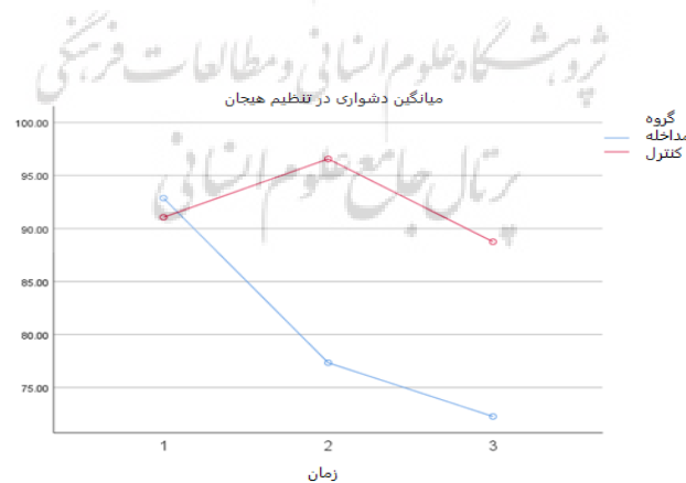
نمودار ۲ میانگین دشواری در تنظیم هیجان زنان در دو گروه مداخله و کنترل در سه مرحله اندازه

میانگین دشواری در تنظیم هیجان زنان در دوره بارداری و پس از زایمان در دو گروه مداخله و کنترل در نمودار حاکی از این است که گروه کنترل در متغیر دشواری تنظیم هیجان از پیش‌آزمون به پس‌آزمون