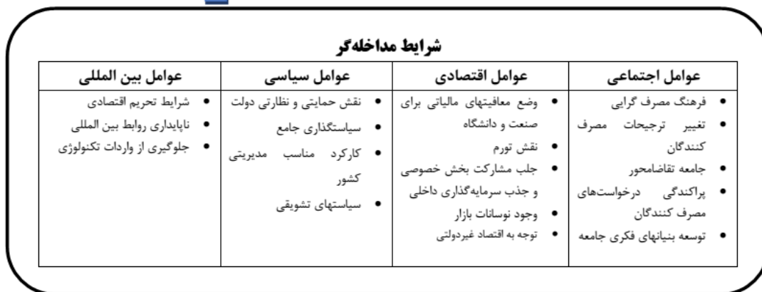
شکل ۱: مدل پارامتری بازار دانش مبتنی بر ارتباط صنعت و دانشگاه