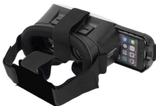
شکل ۲. هدست واقعیت مجازی مبتنی بر تلفن همراه همراه هوشمند