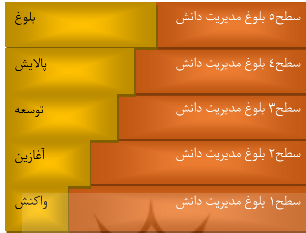
شکل ۱- سطوح مدل بلوغ مدیریت دانش.

الگوهای مختلفی برای بررسی سطح بلوغ مدیریت دانش که بر پایه توسعه‌دهندگان این الگو ویژگی‌های خاص خود را دارد. الگوهای بلوغ دانش را می‌توان براساس عواملی مانند مبنای توسعه الگوها، شرایط اولیه مفروض، نواحی کلیدی بلوغ، چگونگی دستیابی به نیازمندی‌های سطوح و توجه به دینفعان مختلف و توان اجرا طبقه‌بندی نمود (کشاورزی و رادسروش، ۲۰۱۸). ویژگی مشترک الگوهای بلوغ مدیریت دانش در برخورداری از تعدادی سطح محدود و معمولاً پنج سطحی، دارا بودن سطوح ابتدایی تا کمال با دوره بلوغ، با جابه‌جایی قاعده‌مند و عموماً ترتیبی، نیازمندی‌های مشخص و هدف دستیابی به مزایای شناخته شده مدیریت دانش اشاره نمود (علی احمدی و همکاران ۱ ، ۲۰۰۸). سطوح مختلف مدل بلوغ مدیریت دانش در شکل ۱ نشان داده شده است.