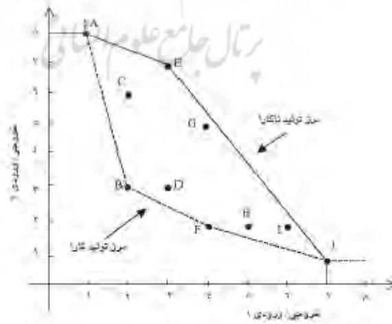
شکل ۱- مرزهای کارا و ناکارا برای دو ورودی و یک خروجی.

در رویکرد تحلیل پوششی داده‌های متعارف به طور اکید بین واحدهای تصمیم‌گیری غیرکارا و ناکارا افتراق نمی‌دهد و آن‌ها را به یک معنا به کار می‌برد؛ اما در مدل‌های (۱)–(۴) واحدهای غیرکارا، ناکارا و غیر ناکارا هرکدام به طور موکد افتراق داده می‌شوند، زیرا هر یک معنای خاصی دارند. مرز کارا و ناکارا برای دو ورودی و یک خروجی در شکل ۱ نشان داده شده است (عزیزی، ۲۰۱۲).