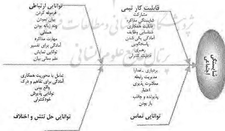
شکل شماره ۳ - چهار رکن اصلی شایستگی های اجتماعی به همراه اجزای آن

۲- شایستگی های اجتماعی: آمادگی، توانایی و پاسخی برای همزیستی با انسان های دیگر است. این ویژگی انجام کار گروهی اثربخش توسط افراد را ممکن می سازد (اسکرویدر، ۷، ۱۹۹۹). چهار رکن اصلی این ویژگی یعنی قابلیت کار گروهی، توانایی حل تنش، توانایی برقراری ارتباطی و توانایی تماس به همراه اجزاء هر رکن در شکل شماره ۳ آمده است.