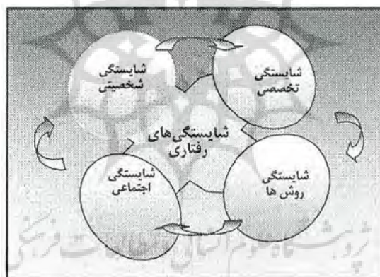
شکل شماره ۱ - ارکان چهارگانه شایستگی‌های رفتاری

برای رسیدن به هدف‌های سازمان و به‌عبارتی دیگر کسب بهره‌وری مناسب نیاز به بروز رفتار مناسب از سوی کارکنان است که آنرا شایستگی رفتاری می‌نامند. شاید در گذشته نه چندان دور بیشترین تمرکز عمدتاً بر بروز رفتار تخصصی افراد بود، اما امروزه با توجه بر رشد دانش و سرعت تغییرات مجموعه‌ای از شایستگی‌های رفتاری یعنی شایستگی‌های: شخصیتی، اجتماعی، روش‌ها و تخصصی از کارکنان انتظار می‌رود (هگر، هسلهلم ۵ ۲۰۰۰). هر یک از این شایستگی‌ها نقش خاصی را برای سازمان‌ها ایفاء می‌کنند که هر چند شرط لازم هستند ولیکن شرط کافی نیستند بلکه می‌بایستی تمامی آن‌ها با یکدیگر بروز نمایند تا شرط کافی نیز برقرار شود (شکل شماره یک). یعنی از طریق تأثیر متقابل و شبکه‌ای و ایجاد سینرژی (هم‌افزایی) ما بین رفتارهای مورد انتظار، شایستگی رفتاری مطلوب بروز خواهد نمود (ریشتر، ۱۹۹۵). در ادامه با اختصار اجزاء هر یک از این ارکان چهارگانه شایستگی رفتاری کارکنان معرفی می‌شود.