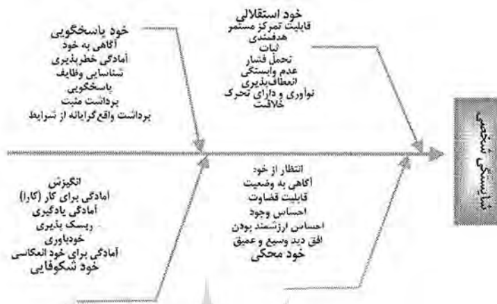
شکل شماره ۲ - چهار رکن اساسی شایستگی های شخصیتی به همراه اجزای آن

۲- شایستگی های اجتماعی: آمادگی، توانایی و پاسخی برای همزیستی با انسان های دیگر است. این ویژگی انجام کار گروهی اثربخش توسط افراد را ممکن می سازد (اسکرویدر، ۷، ۱۹۹۹). چهار رکن اصلی این ویژگی یعنی قابلیت کار گروهی، توانایی حل تنش، توانایی برقراری ارتباطی و توانایی تماس به همراه اجزاء هر رکن در شکل شماره ۳ آمده است.