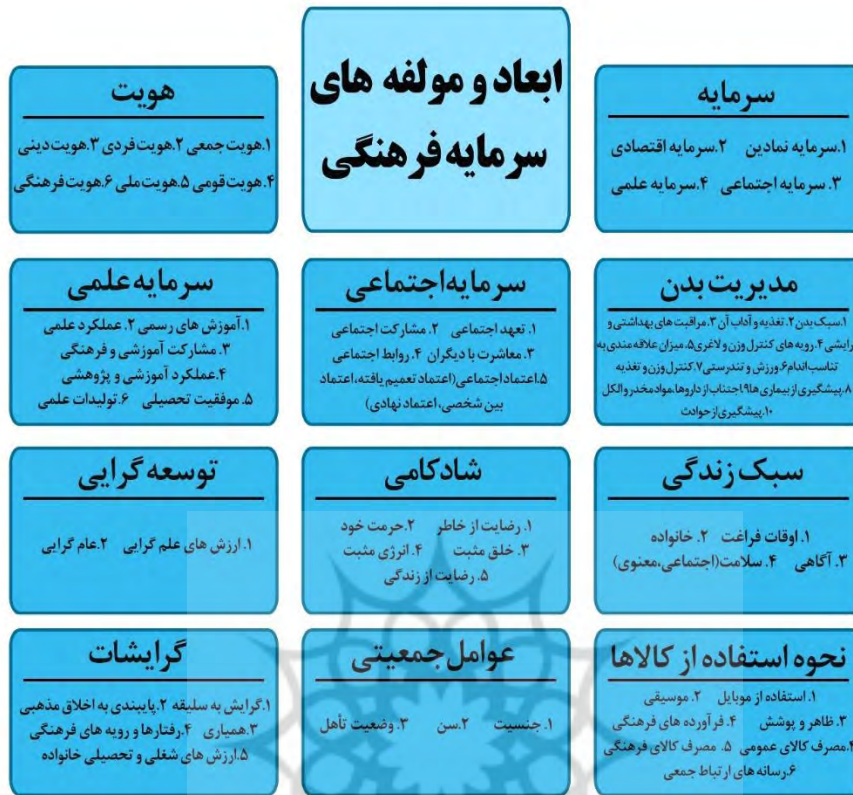
شکل ۲- ابعاد و مؤلفه‌های سرمایه اجتماعی (ماخذ: نگارندگان)

مرحله ششم: تعیین کیفیت نتایج: محقق جهت کنترل نتایج استخراجی خود از مقایسه نظرات خود با چند خبره دیگر نیز استفاده نموده است و سپس نتایج از طریق شاخص کاپا ارزیابی و مورد تایید قرار گرفت. مرحله هفتم: اعلام نتایج: در این مرحله از روش فرا ترکیب، یافته‌های حاصل از مراحل گذشته در قالب یک مدل بر اساس ابعاد و مؤلفه‌ها ارائه می‌گردد.