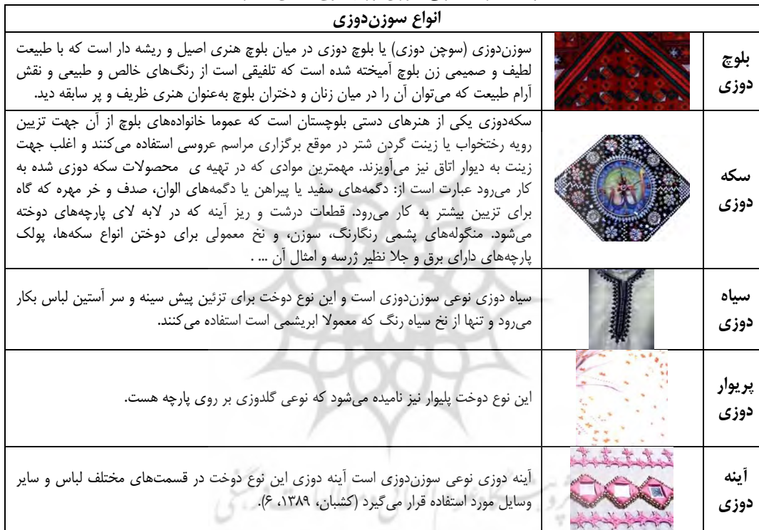
جدول شماره ۲. انواع سوزندوزی بلوچ. (منبع: نگارنده)

در گذشته سوزندوزی بیشتر به صورت قطعات پیش سینه، سرک آستین و جیب تهیه می‌شود و لباس‌های زنان بلوچ با این سوزندوزی‌ها آرایش می‌یافت. در اکثر روستاهای بلوچستان پیراهن بلوچ با چهار قطعه تزئین یافته که عبارتند از یک پیش سینه دس دوزی شده که جیگ ۱۸ یا زیگ ۱۹ نامیده می‌شود و یک جیب بزرگ از روی شکم تا لب دامن به اسم گومتان ۲۰ و دو سر آستین به نام آستینگ ۲۱ . علاوه بر این روی درزهای جامگ را که سرپگ ۲۲ می‌گویند شیرازه دوزی می‌کنند حاشیه دامن نواری گلدوزی است به اسم پیت. از این قطعات به‌عنوان فرآورده‌های بومی یاد می‌شود. و در بعضی نقاط مانند مهنت، مته سنگ، نکوچ، کاج، آموران و چانف، علاوه بر قطعات فوق، نوار نیز سوزندوزی می‌شود که به مصرف لبه چادر یا مصارف دیگر می‌رسد. اما نوع محصول رایج در تمام نقاط همان چهار قطعه پیشین بوده و شاید گاهی سرمه دان جانماز باشد (دکالی، ۱۳۸۵، ۹۹). (جدول ۲)