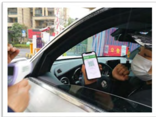
شکل ۶- نرم‌افزار کاربردی نشان‌دهنده «کد سلامتی»

یکی از چالش‌های مهم استفاده از این برنامه کاربردی، عدم رعایت حریم خصوصی شهروندان چینی است. اغلب مردم چین این سؤال را دارند که این نرم‌افزار کاربردی چگونه کار می‌کند و از این طریق چه داده‌هایی از آن‌ها جمع‌آوری شده و مورد استفاده قرار می‌گیرد؛ چرا که اگر کد قرمز رنگ به کسی اختصاص داده شد، فرد نمی‌تواند آن را تغییر دهد و مجبور است از مقررات سخت و سخت‌گیرانه تبعیت کند (موزور و زانگ، ۲۰۲۰).