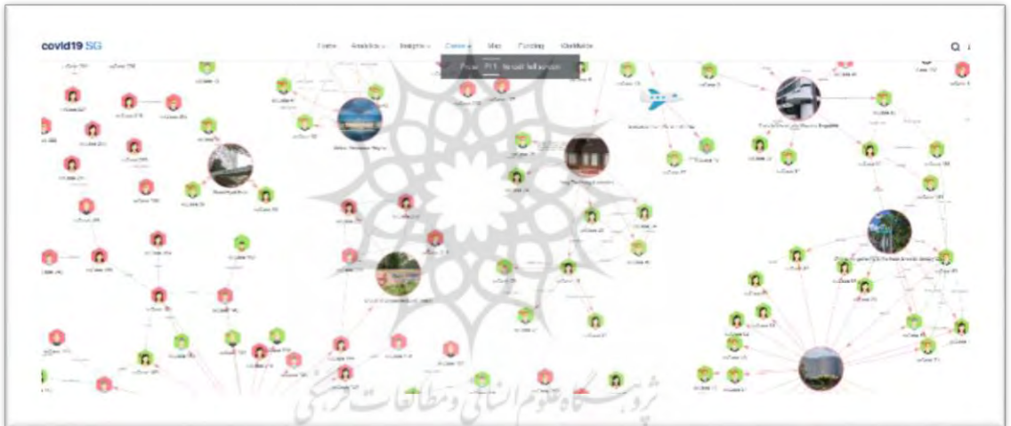
شکل ۴ - نقشه سلامت در قالب شبکه اجتماعی در کشور سنگاپور

سنگاپور ردیابی اطلاعات افراد و مسافران با استفاده از تلفن همراه و همچنین تشخیص چهره با استفاده از دوربین مدار بسته را در دستور کار خود قرار داده است. در موارد به اصطلاح «تماس نزدیک» یا موارد خاص ممکن است از فرد خواسته شود تا به صورت داوطلبانه تلفن همراه خود را در اختیار مراجع ذیصلاح قرار دهد تا داده‌های مربوط به حرکت جی‌پی‌اس مرتبط به او استخراج شده و مورد تحلیل قرار بگیرد. سنگاپور نقشه سلامت در سطح کشور را در قالب تصویری از شبکه‌های اجتماعی ترسیم می‌کند که دائماً در حال به‌روزرسانی است (شکل ۴).