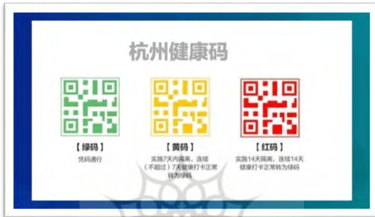
شکل ۵- کد سلامتی مورد استفاده به صورت QR در کشور چین

از مهم‌ترین سیاست‌های قرنطینه در چین، استفاده از «کد سلامتی» ۱ مرتبط با نرم‌افزارهای وی‌چت ۲ و علی‌پی ۳ است که از سیستم‌های دارای کد QR رنگی برای ردیابی مخاطب استفاده می‌کند (شکل ۵) و ارائه آن برای ورود به هر محیطی کاملاً اجباری است. کد QR سبز به معنای شرایط عادی (سالم) برای فرد است. رنگ‌های زرد و قرمز به این معنی است که فرد با یک فرد آلوده به ویروس کرونا، تماس قطعی یا احتمالی داشته است. رنگ زرد یعنی فرد باید به مدت ۱ هفته در قرنطینه بماند و رنگ قرمز یعنی ۲ هفته قرنطینه برای فرد لازم است (داویدسون، ۲۰۲۰).