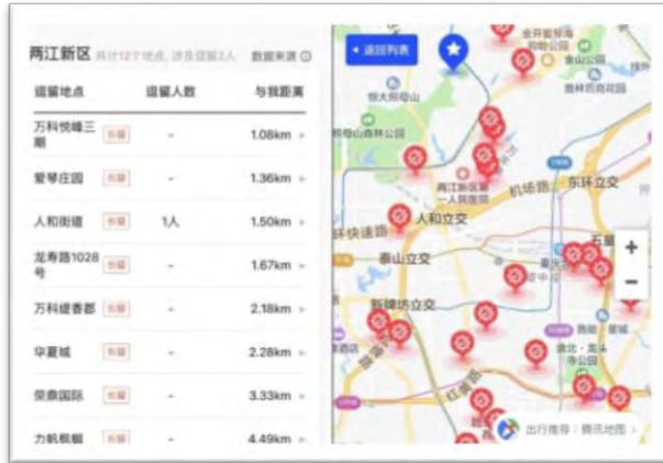
شکل ۷- نقشه سلامتی مرتبط با نرم‌افزار تنبست

دیگر نرم‌افزارهایی که برای مدیریت شیوع کرونا در چین مورد استفاده قرار می‌گیرند از طریق روش‌های ردیابی موقعیت مکانی، افراد را رصد می‌کنند و یا از آن برای ارسال اخبار و هشدارهای شخصی‌سازی شده برای هر شهروند استفاده می‌شود.