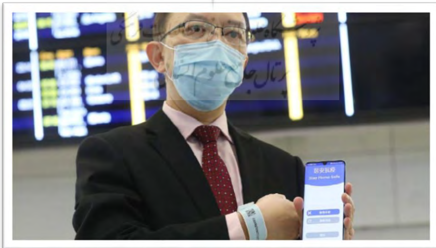
شکل ۱- دست‌بند هوشمند قرنطینه

کشورهای مختلف به منظور جلوگیری از شیوع و گسترش ویروس کرونا، راهکارها و تمهیدات متعدد و متفاوتی را مورد استفاده قرار داده‌اند. در این بخش به بررسی برخی از این تجربیات پرداخته می‌شود. در حال حاضر «قرنطینه هوشمند» در بسیاری از این کشورها مورد استفاده قرار می‌گیرد. برای مثال در شکل ۱، دستبند هوشمند قرنطینه جهت ردیابی افراد در هنگ‌کنگ را نشان می‌دهد که برای رصد همه مسافران تازه وارد به این شهر مورد استفاده قرار می‌گیرد. این دستبند از طریق اتصال به یک برنامه کاربردی نصب شده روی تلفن همراه هوشمند، محل زندگی شخص قرنطینه شده را کنترل کرده و تخلفات رخ داده را به پلیس و دیگر مقامات گزارش می‌دهد.