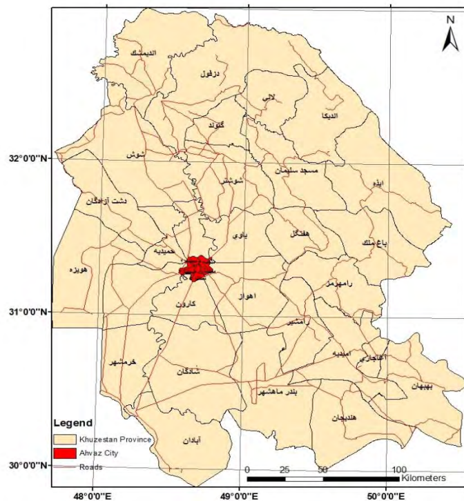
شکل شماره ۱: موقعیت شهر اهواز در استان خوزستان و شهرستان اهواز و راه‌های ارتباطی

می‌شود. پیچ‌وخم‌های موجود در سر راه این رود، خوزستان را به جلگه‌ای بزرگ تبدیل کرده‌است. سدهای مختلفی بر روی این رودخانه ساخته شده‌اند که مهم‌ترین آنها، سدهای کارون ۱، کارون ۳، کارون ۴، سد مسجدسلیمان و در پایین‌تر، سد گتوند علیا و سد تنظیمی گتوند هستند.