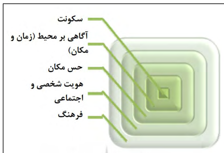
شکل ۲: تاثیر متقابل فرهنگ و سکونت‌گزینی

چون هویت شخصی و گروهی ۲ ، درجاتی از خلوت شخصی و خصوصی بودن فضا را دربردارد» (Rapaport, 2005: 22)